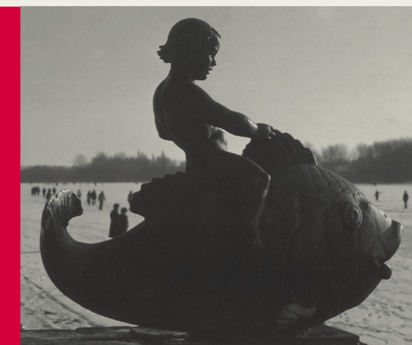
C Fischreiter Hermann Scheuerstuhl gestaltete ein Motiv der abendländischen Kunst. Das Figurenensemble symbolisierte 1937 vor allem die sportliche Nutzung des Sees durch Ruderer und Kanuten oder auch im übertragenen Sinne die Lenkung eines Wasserfahrzeugs – in der nationalsozialistischen Ideologie ein Stück „Kraft durch Freude“.