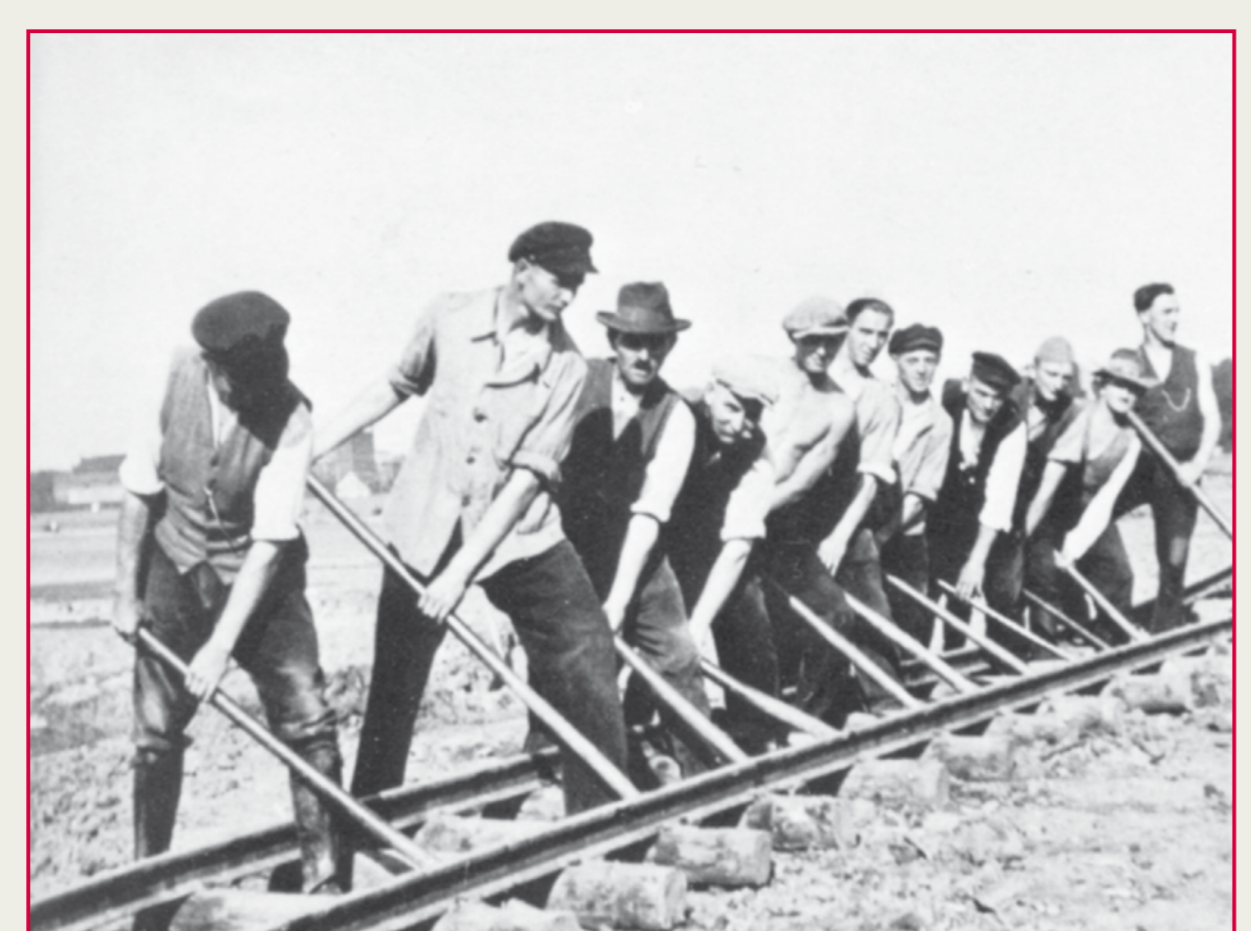
Verlegung von Schienen.