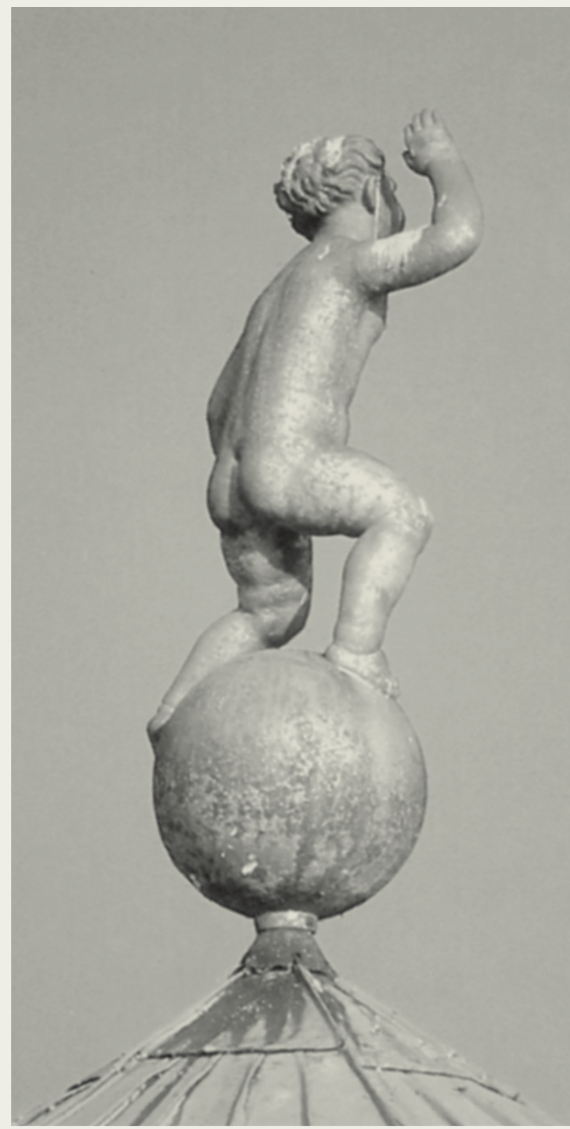
A Putto Putto auf dem Musikpavillon – Hitlergruß oder kindliches Winken? Der Putto auf dem Dach des Musikpavillons, entstanden 1936, wird dem Bildhauer Hermann Scheuerstuhl (1894–1982) zugeschrieben.