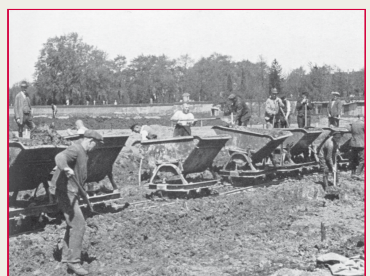
Ausschachtung des Seebeckens.

Die Masch hatte sich schon zuvor zu einem Ort stadtpolitischer Symbole entwickelt. Auf Anregung der Anhänger des 1866 abgesetzten welfischen Königshauses war 1876 die Langensalzpromenade (seit 1888 Straße) benannt worden; Preußenfreunde errichteten 1904 das Denkmal für Rudolf von Bennigsen gegenüber dem Landesmuseum (abgebaut, Platz noch vorhanden). Zur selben Zeit entstand ein Bismarckdenkmal (1935 abgebaut) auf Initiative von Studenten der Technischen Hochschule. Weniger umstritten waren die Skulptur des germanischen Gottes Wotan, aufgestellt 1901 an der Langensalzstraße, und das Denkmal für Gartendirektor Julius Trip im Maschpark (1910).