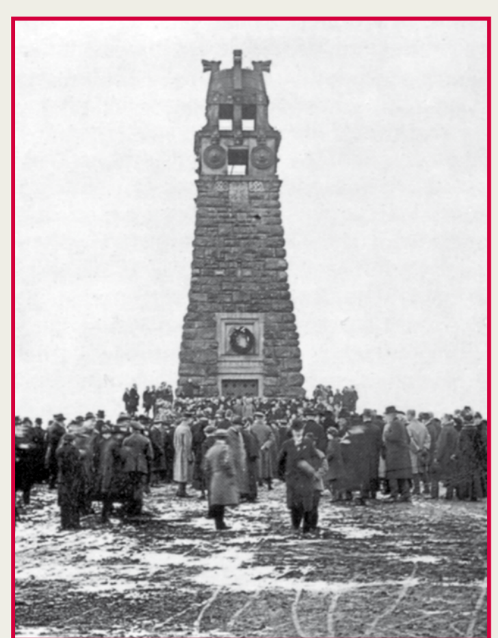
Das Bismarckdenkmal in der Masch wurde am 10. Mai 1933 Schauplatz der von den Nationalsozialisten inszenierten Bücherverbrennungen.

Urbanisierung der Masch Das Gebiet der Leinemasch war schon vor dem Ausbau des Maschsees ein Raum der städtischen Öffentlichkeit. Hannover wuchs und dehnte sich von der Altstadt nach Süden in Richtung des Überschwemmungsgebietes der Leine aus. Der Maschpark wurde 1898–1902 angelegt, der Engesohder Friedhof 1871–1880 erweitert. Es folgten der Bau für die Höhere Töchterschule und Lehrerinnen-Bildungsanstalt (1908, heute Wilhelm-Raabe-Schule) und der Bismarckschule (1911). Der in der Leinemasch erwogene Bau der Stadthalle wurde auf der Bult ausgeführt.