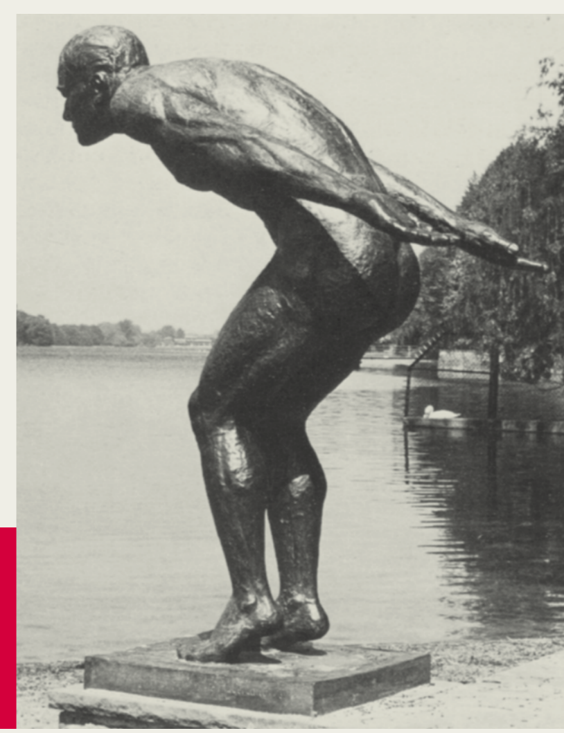
F Schwimmer Die Skulptur von Erich Haberland (1903–1964) ist wohl im Kontext der übrigen Skulpturen entstanden, wurde aber erst 1948 – nach Ende des Zweiten Weltkrieges (1939–1945) – aufgestellt.