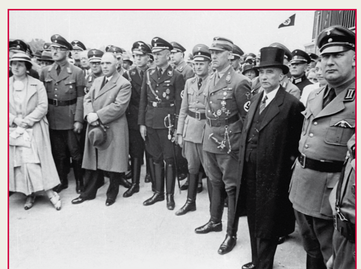
Zuhörer am Nordufer während der Ansprache des Reichsministers und NS-Gauleiters Rust; in Gehrock und Zylinder: Oberbürgermeister Menge.

Am 21. Mai 1936 fand die feierliche Einweihung mit Ansprachen von Reichsminister und NS-Gauleiter Rust (1883–1945) und Oberbürgermeister Menge statt. Zur Ausschmückung des Nordufers mit Kunstobjekten hatte der Unternehmer Fritz Beindorff 50.000 Reichsmark gespendet. Der mit dem Fackelträger gekrönte Pfeiler ging als Sieger aus einem Auswahlverfahren hervor. Die Skulpturen für die Bastionen Geibelstraße (Menschenpaar) und Engesohder Friedhof (Löwenpaar) sind mit Mitteln der Fritz-Behrens-Stiftung finanziert worden.