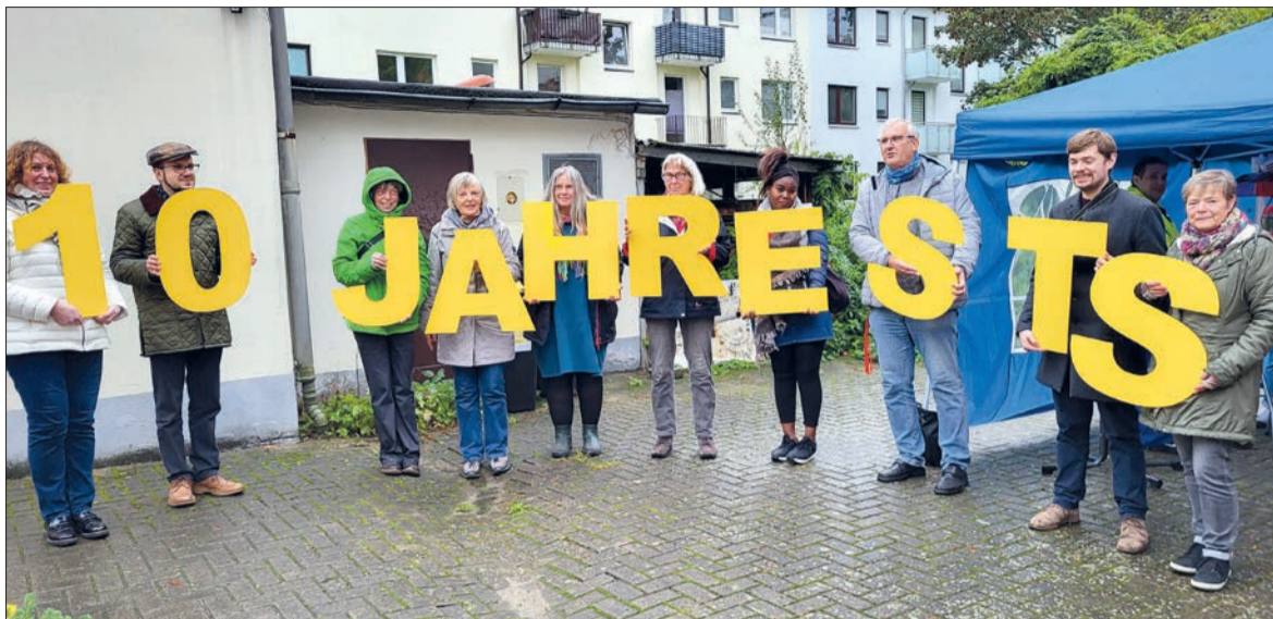
So stimmt die Reihenfolge: Am Ende der Performance war klar, wofür die Buchstaben und Zahlen standen.