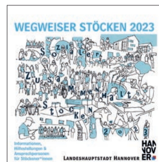
Der Wegweiser durch Stöcken enthält viele nützliche Informationen und Adressen.

festellung sein. Sie wird in gedruckter Form im Stadtteil verteilt und kann als PDF von der Website www.stoecken.info heruntergeladen werden.