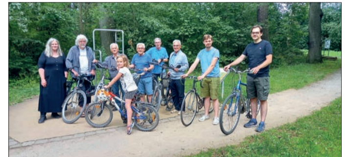
Neun von 26: Das Team beim diesjährigen Stadtradeln war nicht nur zahlenmäßig stark, sondern auch sehr aktiv: Insgesamt radelten die Teilnehmenden innerhalb von drei Wochen fast 6.800 Kilometer.

Kilometer. Das entspricht einer Strecke von Hannover bis Marrakesch in Marokko und zurück. Sie vermieden dabei rund 1.100 Tonnen des klimaschädlichen Gases CO 2 . Auch auf Hannover bezogen lässt sich das Ergebnis sehen: Das Team erreichte immerhin Platz 74 von 413 Teilnehmenden.