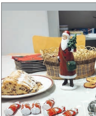
Die Vorweihnachtszeit wird durch das Quartiersmanagement versüßt.

net sich um 16 Uhr die Tür zum Wohncafé des Wohnprojekts WOHNEN PLUS. Die Veranstaltung geht bis 19 Uhr. Was in der Zeit passiert? Das wird nicht verraten. Am besten also vorbeischaun!