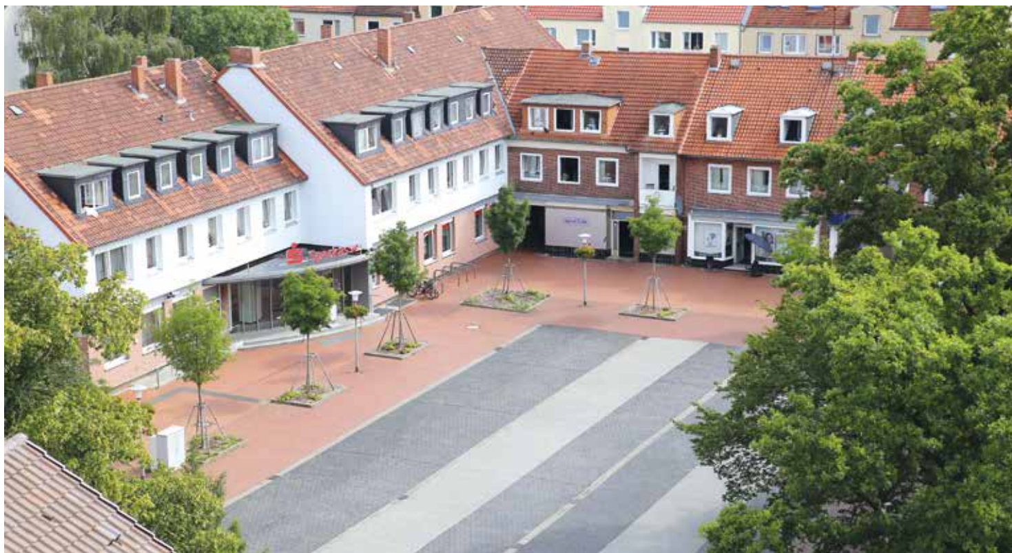
Ofť wirkt der Butjerbrunnenplatz sehr unbelebt. Bei einer Beteiligung wurden viele Ideen geäußert, wie sich das ändern lassen könnte.

Planungen für die Neugestaltung des öffentlichen Raums rund um den Butjerbrunnenplatz schreiten voran – Vorschläge der Bewohner*innen fließen in Überlegungen ein