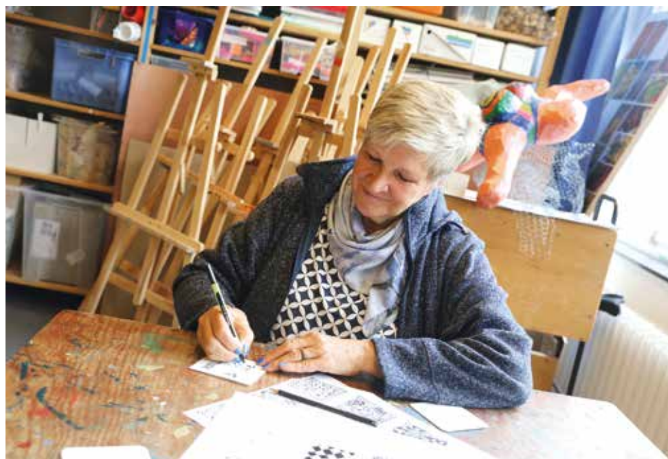
Ob ein frisch zubereitetes Mittagessen, Fachvorträge oder Entspannung beim Malen und Zeichnen – es gab viele Angebote rund ums Thema Gesundheit.