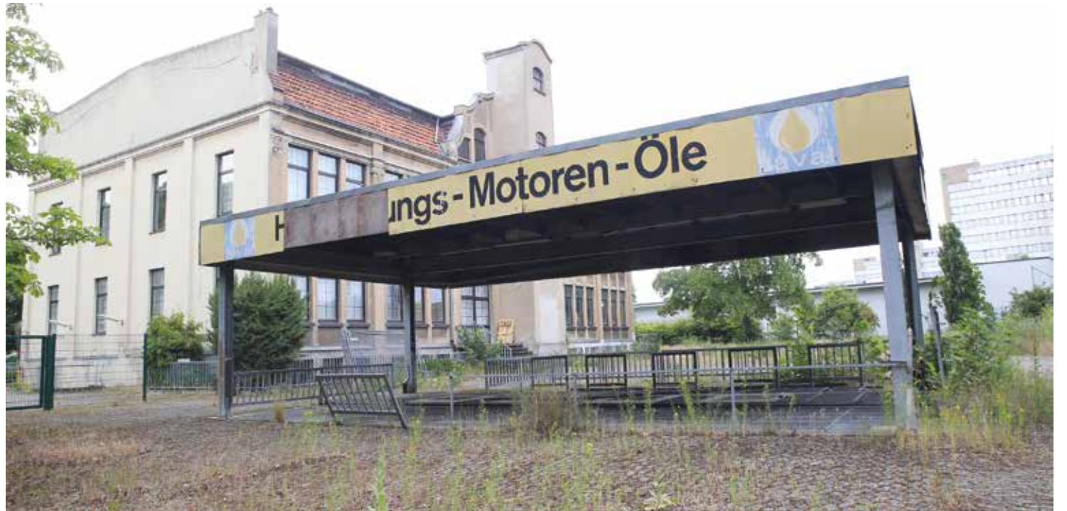
Viele Flächen am Friedländer Weg liegen brach und werden aktuell nicht genutzt. Das soll sich ändern. Ideen für eine Revitalisierung liegen vor, Gespräche laufen.

Auch südlich des Friedländer Weges soll der Bestand weiterentwickelt und durch Neubauten ergänzt werden. Für Neubauten ist auf den vorhandenen Freiflächen Platz. Auf dem Gelände zwischen Motoren Henze und der ehemaligen Großdruckerei Petersen gibt es grundsätzlich zwei Möglichkeiten: Die bestehenden Werkstätten, Lager und Büros werden nachgenutzt und vermietet oder sie werden demontiert. Dann könnten dort neue Gebäude entstehen. „Die Investoren, die das Gelände erworben haben, sind für verschiedene Lösungen offen“, sagt Alexander Rudnick. Er ist mit allen Mieter*innen, Betrieben, Investoren und