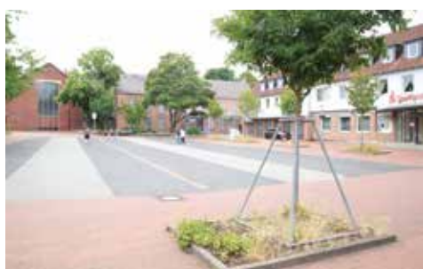
Die Bewohner*innen wünschen sich mehr Grün, Sitzgelegenheiten, Gastronomie und Geschäfte. Auf der gegenüberliegenden Seite an der Wallensteinstraße hat bereits eine neue Bäckerei eröffnet.

Unter anderem soll die Aufenthaltsqualität des Platzes verbessert werden. Dazu sollen mehr Grün und einladende Sitzgelegenheiten beitragen. Außerdem soll der Platz zu Fuß und mit dem Fahrrad leichter erreichbar sein. Auch die Anbindung an angrenzende städtische Räume könnte verbessert werden, etwa indem der Friedländer Weg zwischen dem Butjerbrunnenplatz und dem Supermarkt im ehemaligen Kino verkehrsberuhigt und der Bodenbelag neugestaltet wird. Angestrebt wird zudem ein sicherer Übergang über die Wallensteinstraße, um dort die Ladenzeile besser erreichen zu können.