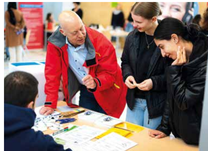
Beratung zum Anfassen: Viele Aussteller*innen hatten praktische Beispiele mitgebracht, die typisch für die jeweiligen Berufe sind. Vor Ort kamen die jungen Besucher*innen mit Auszubildenden und Verantwortlichen der Unternehmen ins Gespräch und konnten auch gleich ihre Kontaktdaten da lassen.