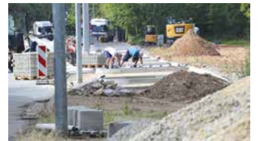
Die ehemalige Großdruckerei beherbergt heute viele kleine Firmen. Das soll auch künftig so bleiben. Veränderungen sind hingegen bei der Gestaltung der Straße gewünscht. An der Erschließungsstraße des Edeka-Marktes und Finanzamtes entstehen parallel zur Frankfurter Allee neue Parkplätze.