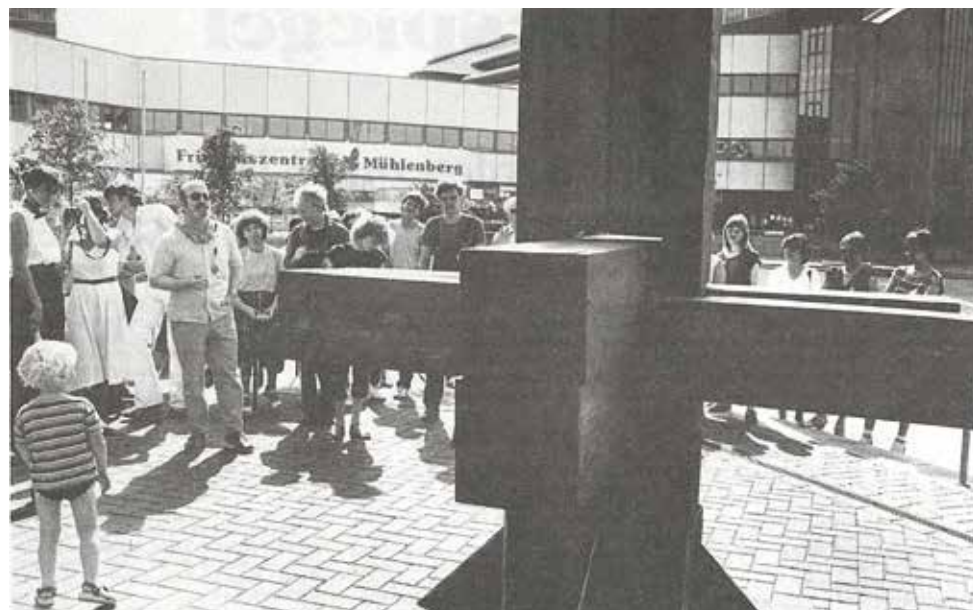
Vor rund 40 Jahren wurde das Knotenkreuz im Stadtteil Mühlenberg aufgestellt.