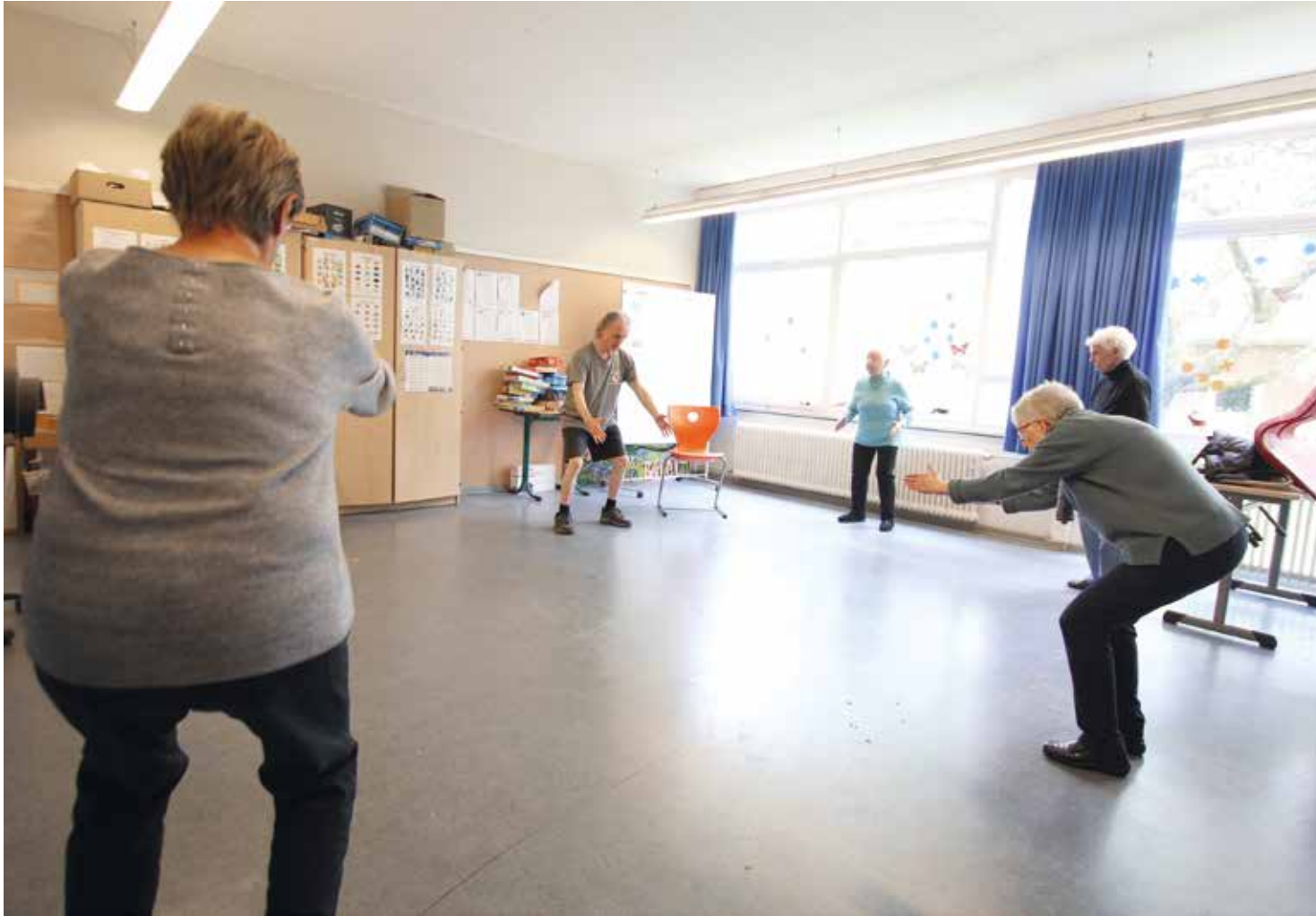
Bücken mit geradem Rücken: Die Teilnehmer*innen an dem Workshop lernten, wie sie sich im Alltag bewegen, ohne sich zu sehr belasten.

Die diesjährigen Gesundheitstage in der Peter-Ustinov-Schule sprachen erneut alle Altersgruppen an