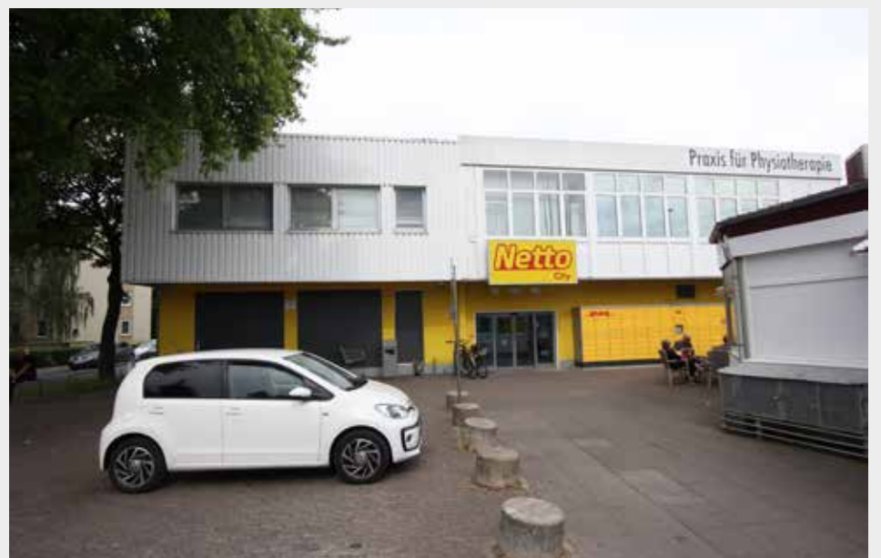
Ein eigenes Kino in Oberricklingen? Lang ist's her. Das Ring-Theater (Riki) wurde 1955 an der Wallensteinstraße/ Ecke Friedländer Weg eröffnet und bot 603 Sitzplätze. Bereits 1971 musste es wieder schließen. Heute befinden sich in dem Gebäude unter anderem ein Supermarkt und eine Physiotherapie-Praxis.