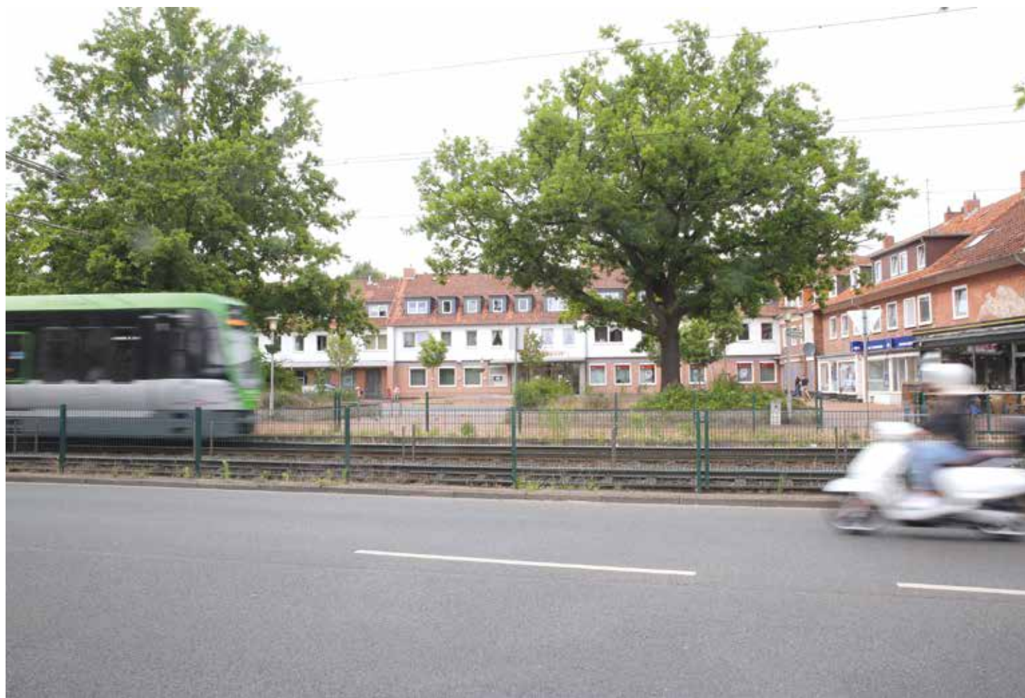
Straße und Gleis beschränken an einer Seite den Zugang zum Butjerbrunnenplatz. Eine Verbindung zur gegenüberliegenden Ladenzeile ist nur schwer möglich.

Die März-Sitzung stand im Zeichen der Information über die von Sanierungskommission gestellten Anträge und angestoßenen Projekte. Einige sind allerdings stark von Entscheidungen Dritter abhän-