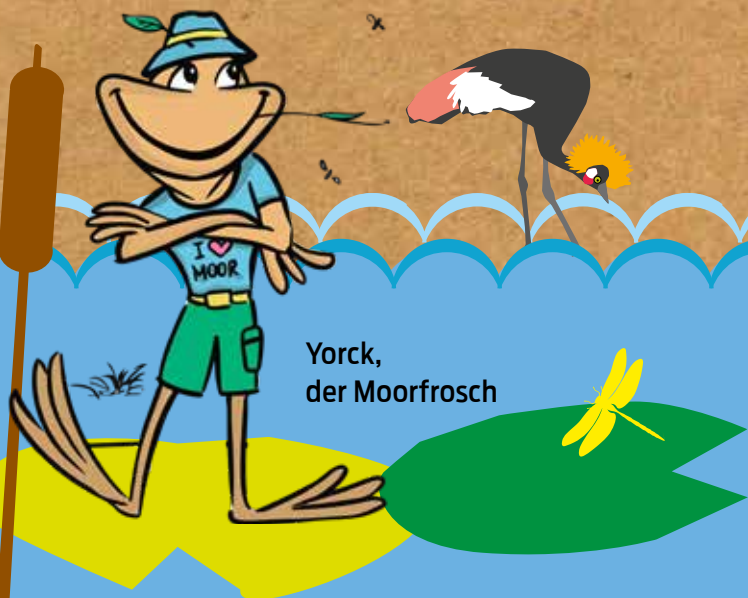
Yorck, der Moorfrosch

Oder musstet ihr schon mal vor einer hungrigen Kreuzotter fliehen und mit einem schlecht gelaunten Torfmoos diskutieren? Brrrh, ich kann euch sagen! Und dann der große Moorbrand – wenn ich als Chef der Froschfeuerwehr damals nicht ... Aber das könnt ihr euch alles selbst anhören, in unseren spannenden und lustigen Hörspielen!“