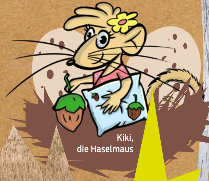
Kiki, die Haselmaus

„Eigentlich bin ich gar keine Moorbewohnerin. Aber als Haselmaus lebt es sich heute auch nicht leicht. Überall Straßen, Häuser und Äcker. Wo soll man da einen Platz zum Schlafen finden? Darum bin ich mit Sack und Pack ins Moor umgezogen. Anfangs war das ganz schön ungewohnt, aber zum Glück habe ich Yorck getroffen. Der kennt von Neustadt bis Altwarmbüchen jedes Wasserloch! Mit Yorck zusammen erlebe ich jeden Tag etwas Neues. Wir treffen kriminelle Elstern und verrückte Moormaler, einen verfressenen Kranich und viele andere ulkige Typen. Langweilig wird das nie und nebenbei lerne ich eine Menge über das Moor.“