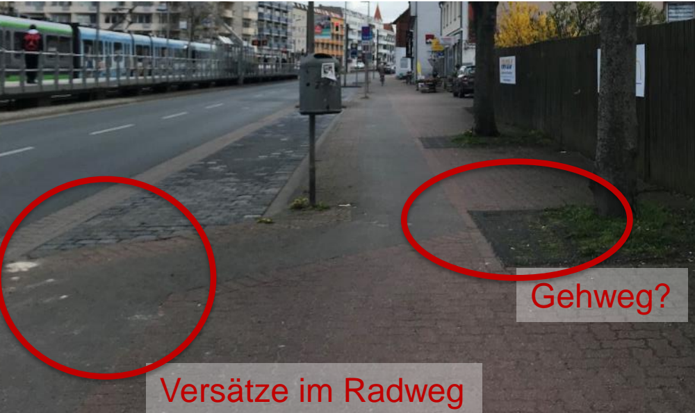
Versätze im Radweg