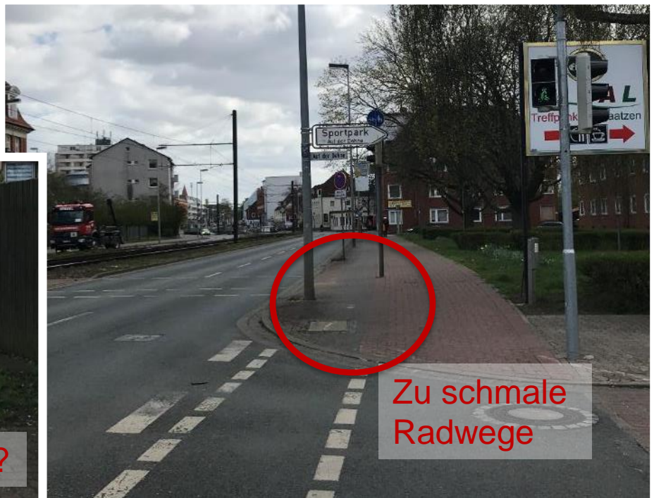
Zu schmale Radwege