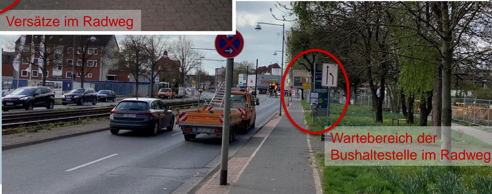
Wartebereich der Bushaltestelle im Radweg