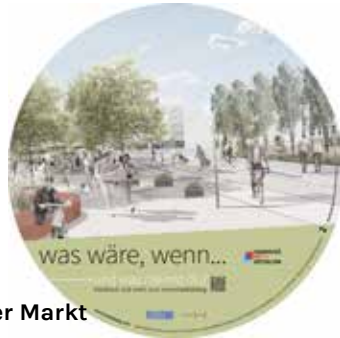
2 Köbelinger Markt