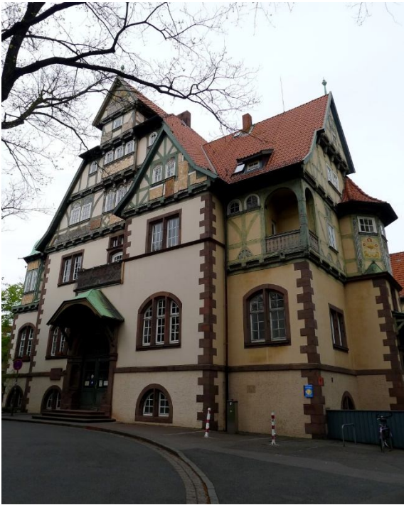
Station Lister Turm