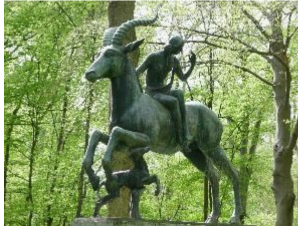
Station Statue „Frau mit Reittier“