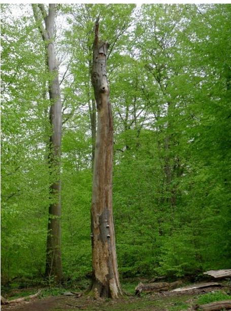
Station An der Kreuzung