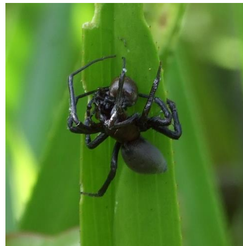
ABBILDUNG 2: GROÙE BEUTE WIRD AUCH ÜBER WASSER GEFRESSEN