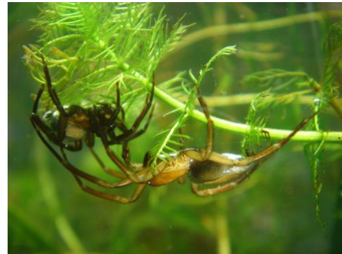
ABBILDUNG 1: MÄNNCHEN UND WEIBCHEN VON ARGYRONETA AQUATICA UNTER WASSER

Sie holen von der Wasseroberfläche Luft, die sie dann wie eine silbrig glänzende Hülle umgibt. Damit bauen sie eine Luftglocke im Wasser zwischen Hohlräumen. Man findet diese giftige Spinne am häufigsten in norddeutschen Moorweihern, selten in Süddeutschland.