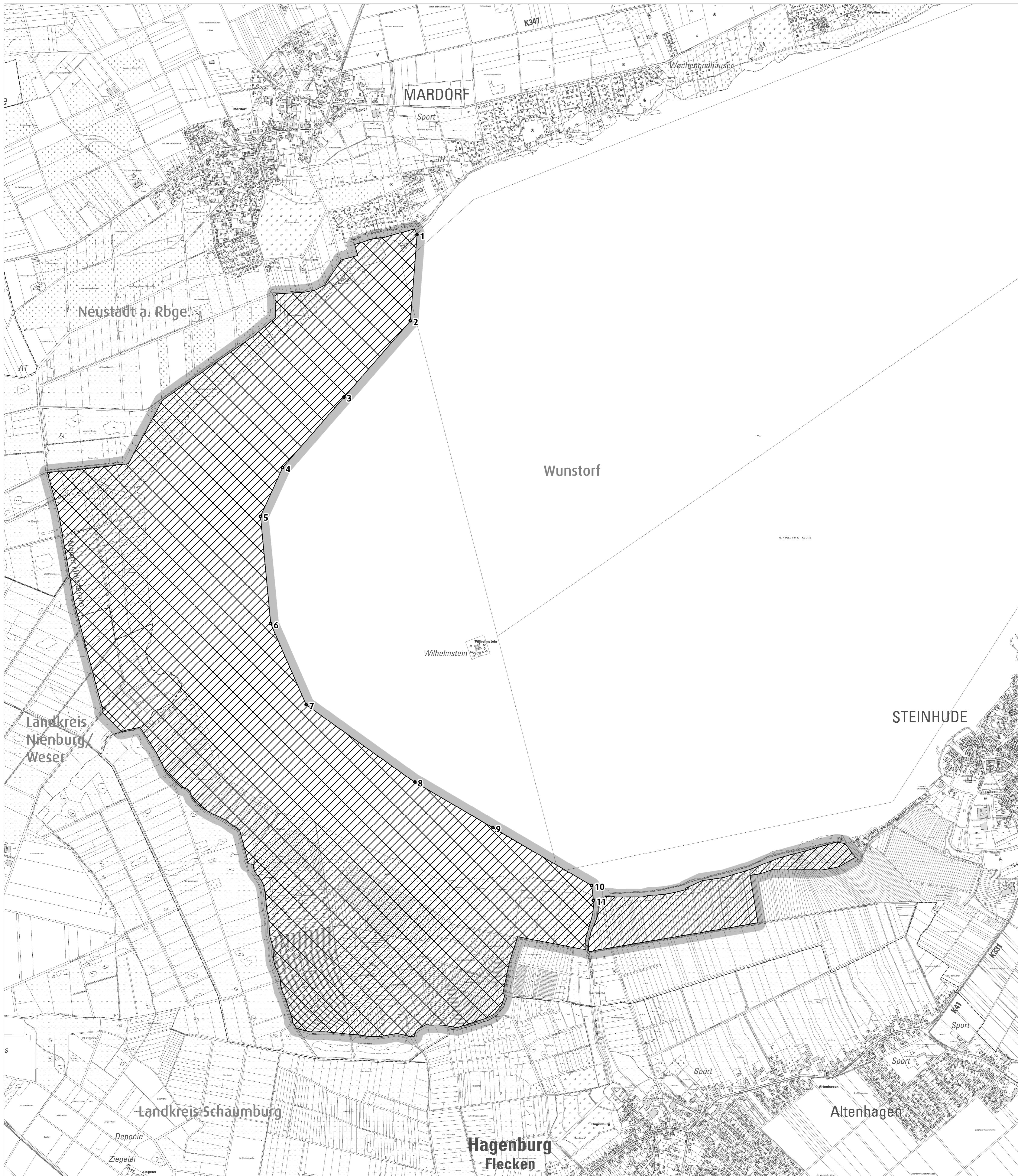
Übersicht M. 1:50.000