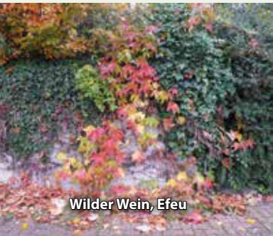
Wilder Wein, Efeu