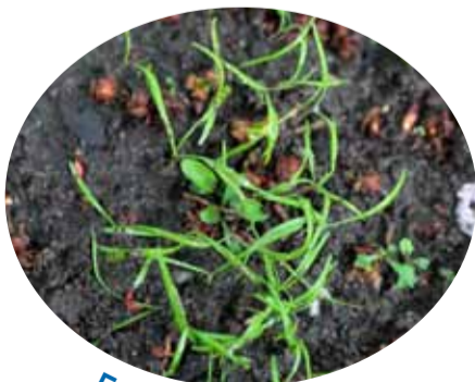
5: n u