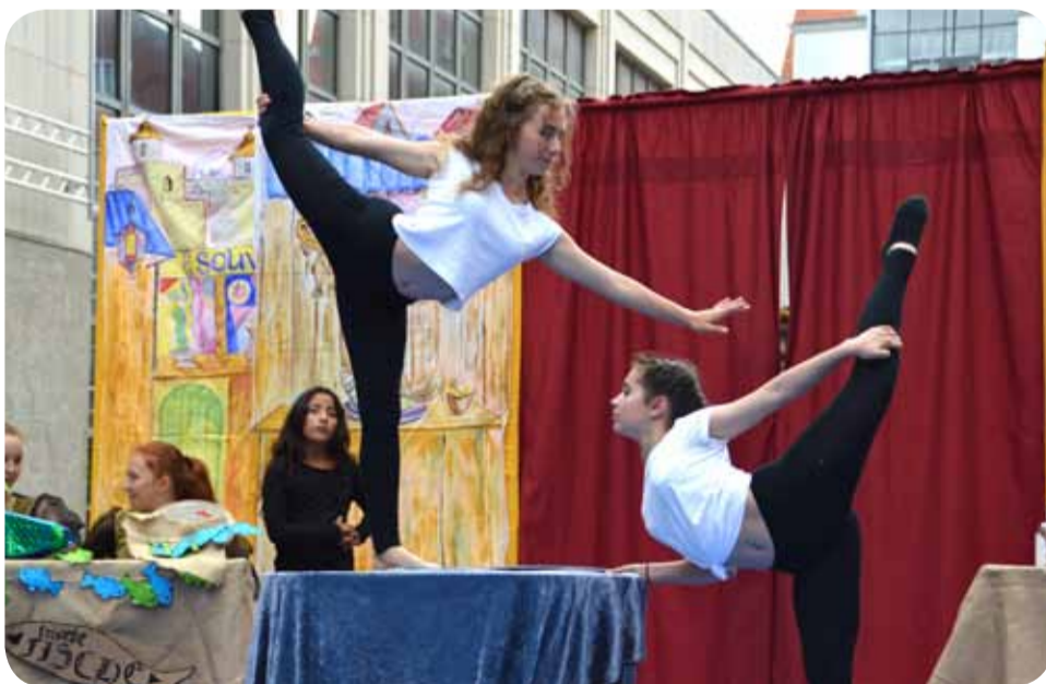
Einfach ist das nicht: Spagat auf einem Bein. Übung macht die Meisterin.

Die Sahlino Kids sind wieder los und zum Jubiläum nach 15 Jahren wilder als je zuvor