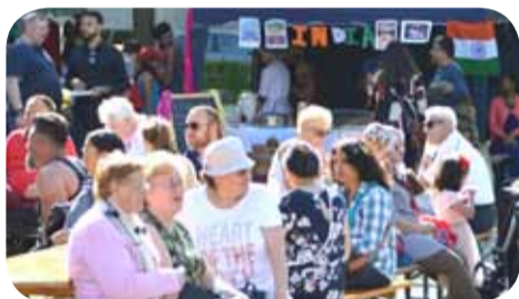
Es gibt immer viel zu erzählen.