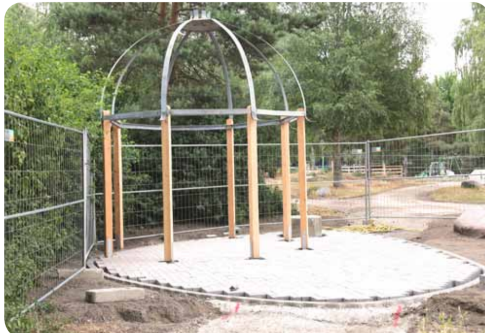
Der Rosenpavillon ist gewandert: Vom Rodelberg (Bild oben) zum Südrand des Familienzentrums Hægewiesen (Bild unten).

flächen mit Blumenbeeten. Hier kann künftig Boule gespielt werden. Zwei Tischtennisplatten beleben den Bereich. Astrid Macaj meint: „Diese gesamte Vielfalt ist einfach großartig.“