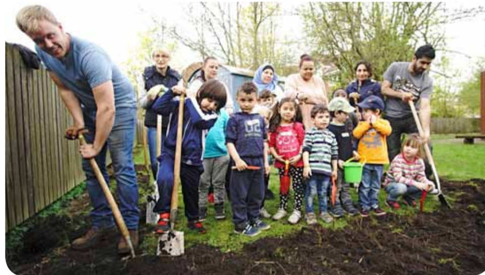
Bei der Gartenarbeit sind alle dabei.

Im Familienzentrum sind alle Eltern und ErziehungspartnerInnen willkommen. Hier leben und lernen Kinder und Erwachsene aus unterschiedlichen Herkunftsländern sowie Menschen mit und ohne Beeinträchtigung zusammen. Achtung und Respekt vor den jeweiligen Fähigkeiten prägen den Alltag. Dazu gehört die Bereitschaft zur Akzeptanz und fairen Auseinandersetzung. Die Arbeitsweise ist „geöffnet“. Das bedeutet: Die Kinder suchen sich innerhalb bestimmter Zeiten ihre Spielbereiche und Angebote selbst aus. Schwerpunkt der pädagogischen Arbeit ist Beteiligung. Gearbeitet wird nach dem Situati-