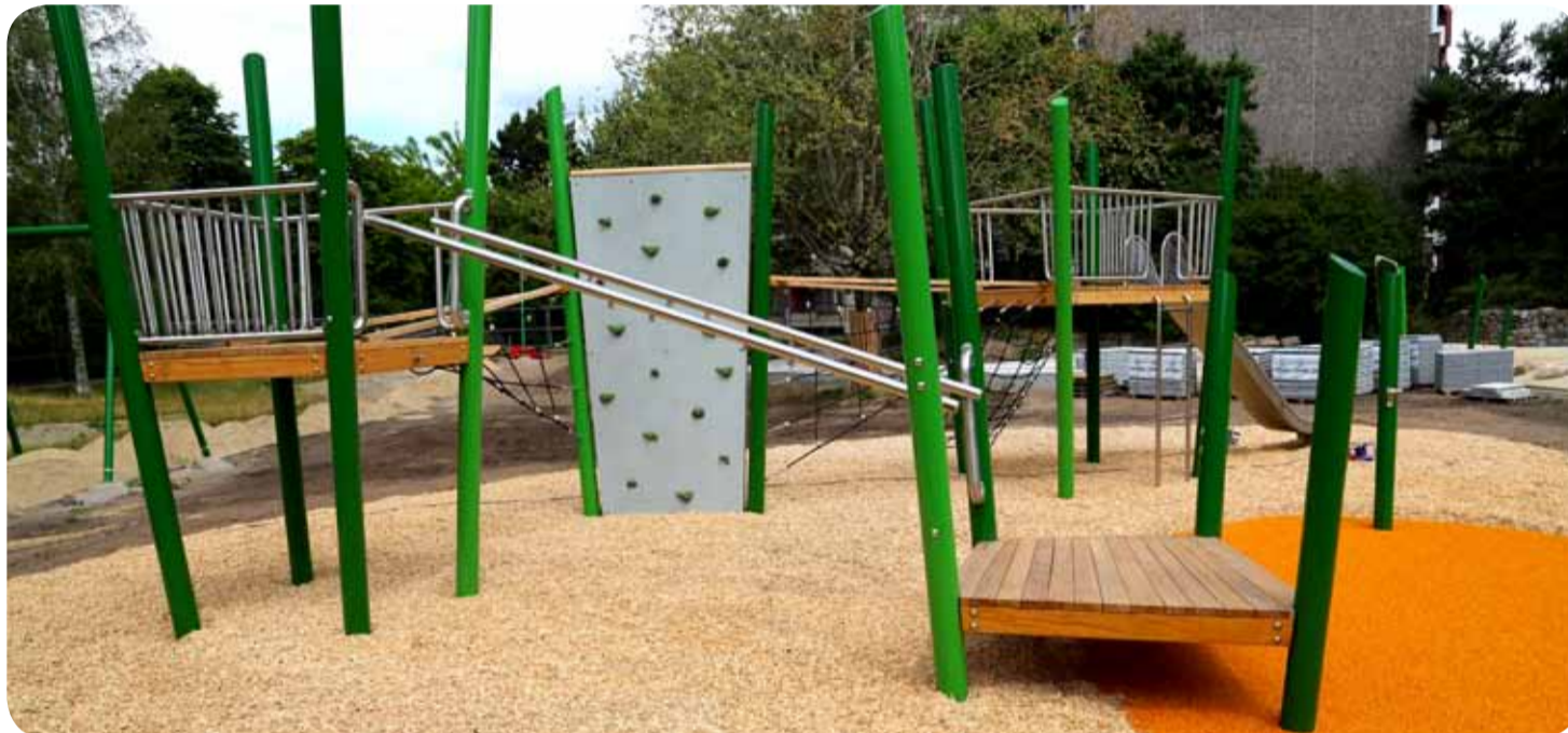
Der Stadtteilpark wird neu gestaltet, die ersten Spielgeräte stehen schon. Im September feiern alle das große Eröffnungsfest.

Projekte für mehr Wohnqualität vor dem Abschluss / Zeitung sucht Mitmachende