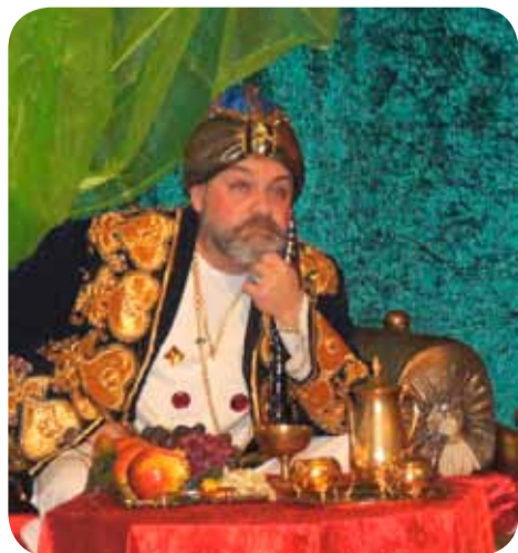
Schmucke Kostüme gehören dazu.