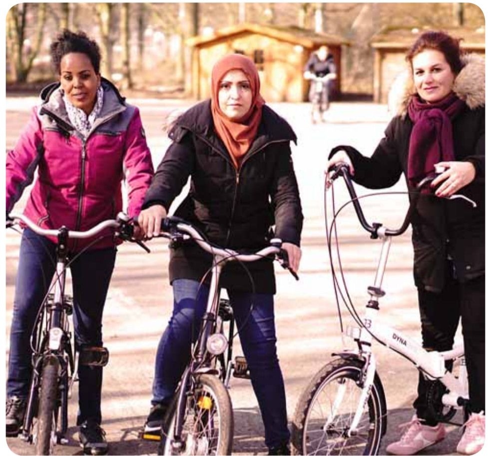
Der Schulhof der Grundschule Hägewiesen diente den Frauen als Übungsparcours.

Doch zuvor mussten die Verkehrsregeln gelernt werden. Theorie gab es in einem Schulraum, wozu alle wichtigen Fragen des Straßenverkehrs gehörten. Die Frauen sprachen auch über die Regeln und Verkehrssituation in ihren Heimatländern und konnten sie mit denen in