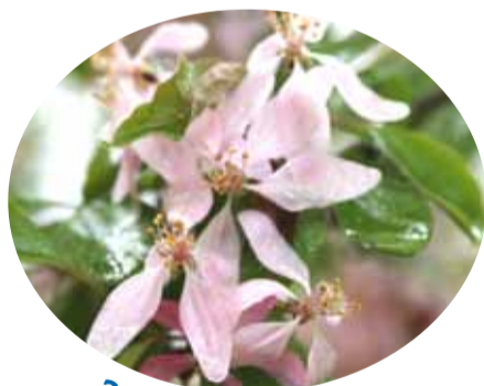
3: a r h