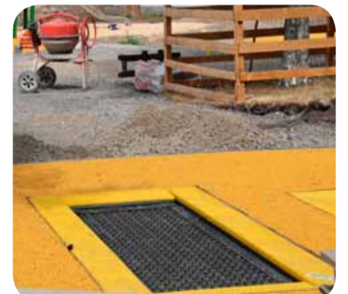
Die ersten Trampoline sind schon da. Weitere Spielgeräte werden in Kürze aufgebaut.

Das Projekt kostet insgesamt rund 750.000 Euro und wird aus Städtebaufördergeld aus dem Sanierungsprogramm „Soziale Stadt“ finanziert. Die Planung übernahmen die LandschaftsarchitektInnen des Büros „Grün plan“. Voran ging eine frühe Beteiligung der AnwohnerInnen, die auf große Resonanz gestoßen war. Im August 2016 hatte es einen Abschlussworkshop gegeben. Rund 200 Frauen und Männer, Jugendliche und Kinder nahmen an sechs verschiedenen Beteiligungsaktionen teil.