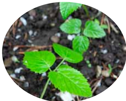
6: e r