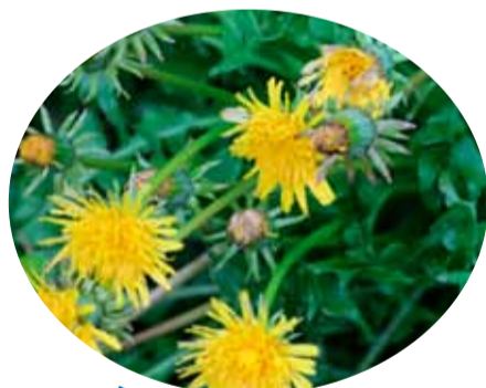
1: e n

Unser Tipp: Komm doch mal vorbei und schau, was aus diesen Gewächsen heute geworden ist. Vielleicht findest du ja auch eine leckere Erdbeere.