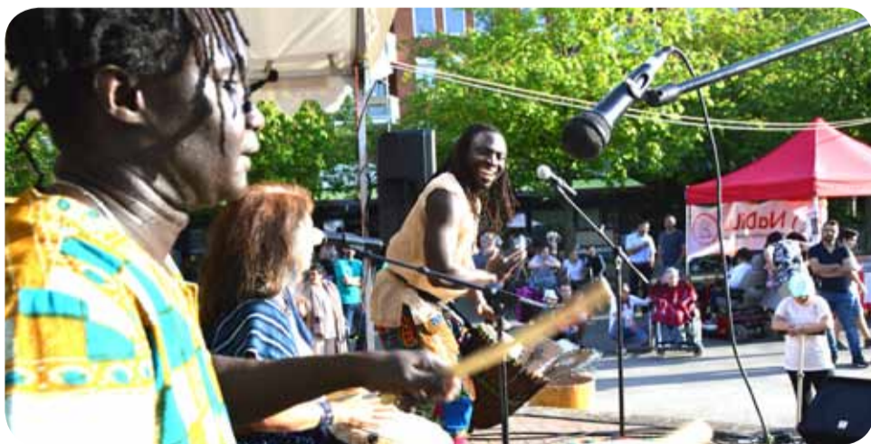
Trommelwirbel für gute Stimmung: Die Gruppe Batamba Moolu begeisterte Jung und Alt.

Auf dem Sahlkampmarkt feierten 700 Gäste