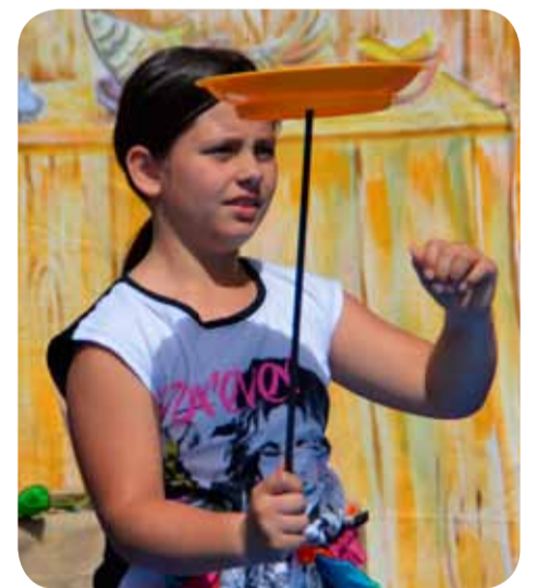
Einfach kreisen lassen.

Wer mitmachen will, meldet sich im Stadtteiltreff Sahlkamp, Tel. 0511/168-4 80 51.