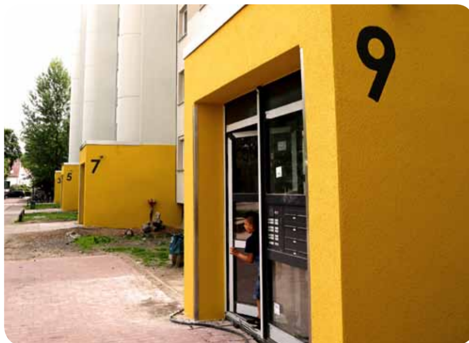
Ein fröhlicher Akzent: Die neuen Hauseingänge strahlen gelb.