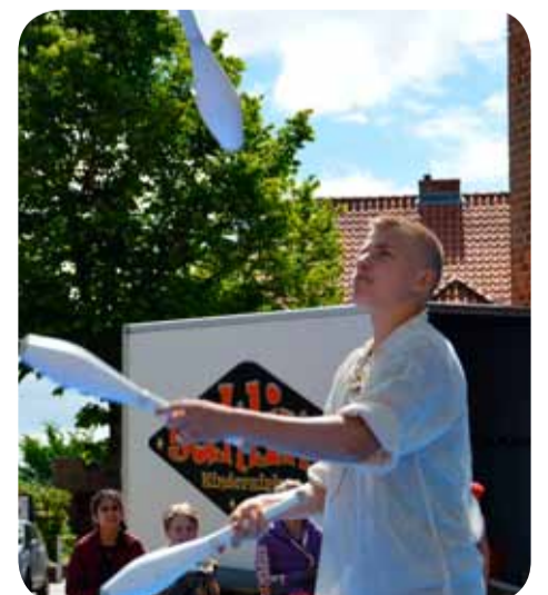
Einfach fangen und loslassen.