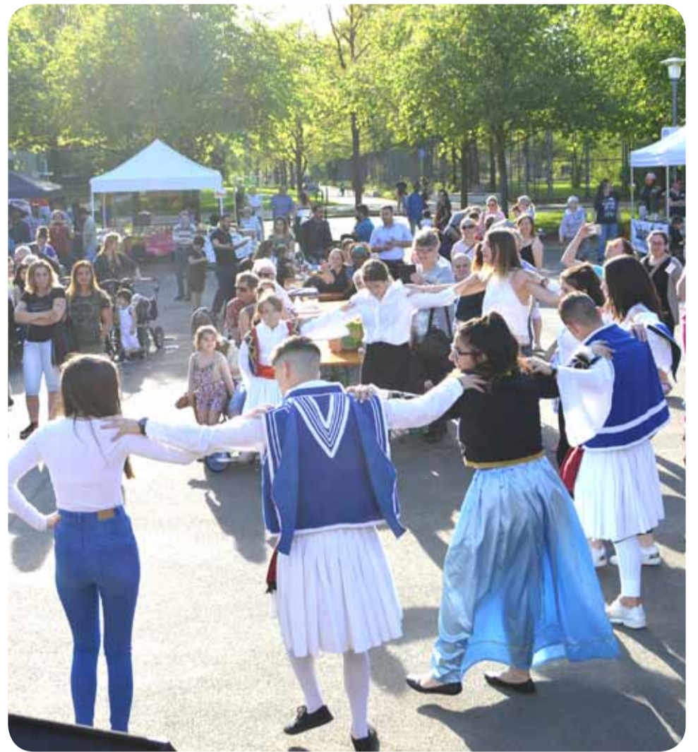
Die griechische Gruppe Hellas tanzt Sirtaki und alle machen mit.

Der Internationale Tag wird seit 2005 alle drei Jahre vom Stadtteiltreff Sahlkamp veranstaltet, um das Miteinander zwischen den verschiedenen Kulturen zu stärken. In diesem Jahr wurde das Fest mit in die Reihe „Buntes Flair auf dem Sahlkampmarkt“ aufgenommen und gemeinsam von der Stadtteilkultur und Gemeinwesenarbeit aus dem Stadtteiltreff sowie dem Gewerbetmanagement NORD GbR und der Interessengemeinschaft „Sahlkamp Mittendrin“ veranstaltet.