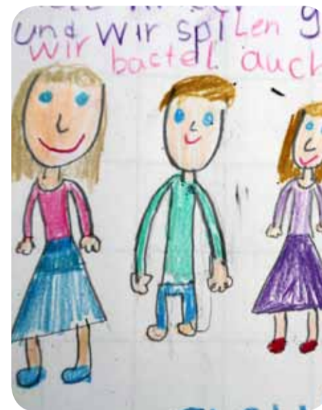
Ein Tag im NaDu-Kinderhaus – gemalt von Nora.

Das hat nichts mit Zahnlücken zu tun, wie du schnell denken könntest. Es geht dabei um Betreuung. Bis zum Alter von sechs Jahren gehst du in den Kindergarten und mit 14 Jahren kannst du schon zum Jugendtreff gehen. Zwischen sechs und 14 Jahren besteht also eine Lücke, was die Betreuung nach der Schule angeht. Deshalb haben wir im Sahlkamp für diese Lückekinder das NaDu-Kinderhaus. In der Umgebung leben übrigens rund 350 Lückekinder.