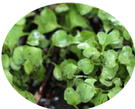
2: s e