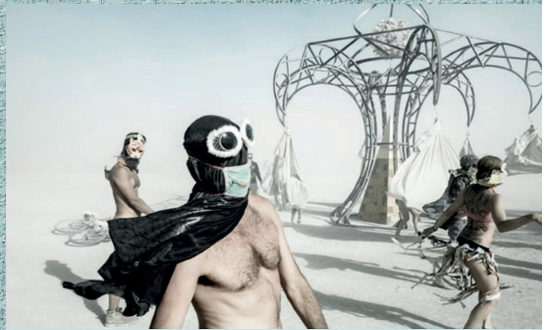
Impression vom internationalen Fotofestival „Visa pour l'Image“ Perpignan