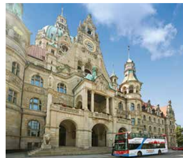
Stadtrundfahrt im Doppeldeckerbus