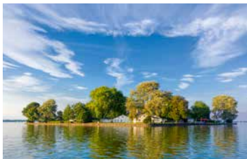
Mitten im Steinhuder Meer: Insel Wilhelmstein