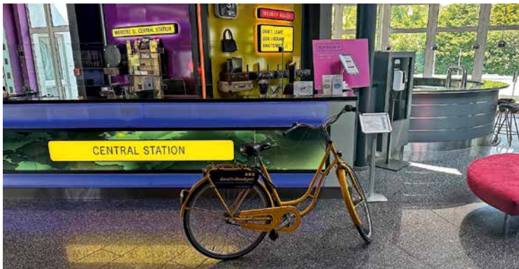
Fahrradfreundliche Hotels entdecken