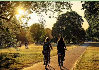
In den Sonnenuntergang radeln