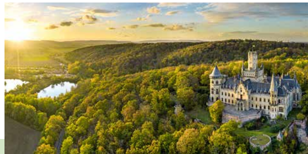
Märchenhaftes Ausflugsziel: Schloss Marienburg