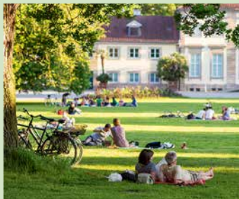
Fahrradpause im Georgengarten