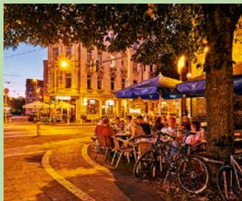
Ganz entspannt: mit dem Rad ins Nightlife