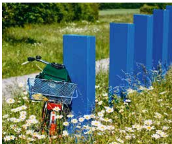
Blaue Wegweiser am Grünen Ring

weisungssystem: Blau gestrichene Objekte wie Zäune, Bänke, Straßenlaternen, Holzpfosten, Bordsteinkanten oder Gullydeckel weisen den Weg. Radelnde und Wanderer können sich so in der Landschaft orientieren. Der Grüne Ring ist natürlich auch in einzelnen Tourenabschnitten befahrbar, die gut an den ÖPNV angebunden sind.