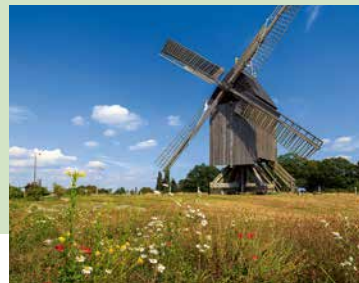
Die Bockwindmühle Wettmar in der Fahrradregion Hannover

Mit vielen weiteren Routen wie dem „Grünen Ring“ oder dem „Deisterkreisel“ lädt die Fahrradregion ein, attraktive Umlandziele wie das Schloss Marienburg, das Steinhuder Meer oder den Deister zu erkunden. Da die Radwege der Fahrradregion nur selten auf steilen Wegstrecken verlaufen, sind sie auch für Freizeitradelnde oder Familien mit Kindern bestens geeignet. Und sollte die Tour einmal zu lang werden oder das norddeutsche Wetter plötzlich Kapriolen schlagen: In Kombination mit den Angeboten zur Fahrradmitnahme im Öffentlichen Personennahverkehr (ÖPNV) lassen sich Teilstrecken bequem mit Bus, Bahn und Zug zurücklegen.