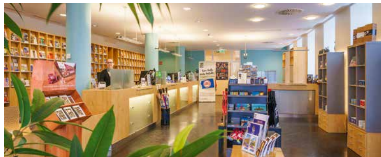
Die Tourist Information am Ernst-August-Platz

Mo.–Fr. 9.30–17.30 Uhr Sa. und So. 10.00–17.30 Uhr