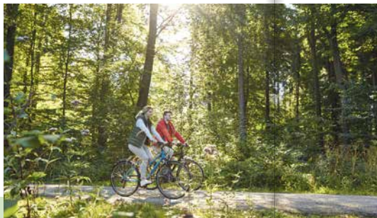
Mit dem Fahrrad durch den Deister

Das Rad ist das perfekte und obendrein gesunde wie umweltfreundlichste Verkehrsmittel, um attraktive Ziele wie stadhistorische Baudenkmäler, die kulturelle Vielfalt der Stadt oder Naherholungsmöglichkeiten wie Maschsee, Eilenriede und Herrenhäuser Gärten zu erkunden.