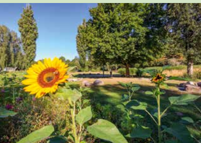
Die Junkerwiese in Seelze