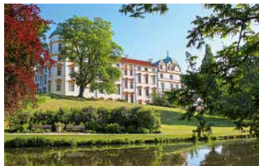
Ein Kulturrouutenziel: das Schloss Celle