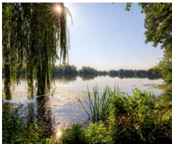
Die Wilkenburger Teiche