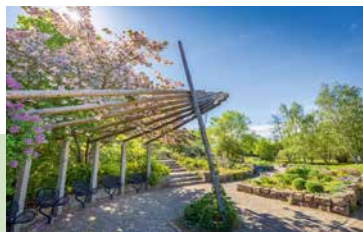
Natur genießen: im Park der Sinne