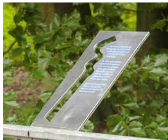
Wassertafeln bieten interessante Informationen