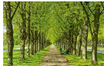
Unter Bäumen: auf der Herrenhäuser Allee

7,5 Kilometer lang ist diese Route vom Hauptbahnhof im Zentrum der Stadt entlang der herrlichen Herrenhäuser Gärten, einer der herausragendsten Besucherattraktionen Hannovers, bis nach Stöcken mit dem großen Werk von VW Nutzfahrzeuge.