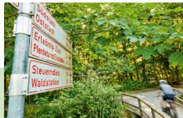
Auf zwei Rädern durch die Eilenriede