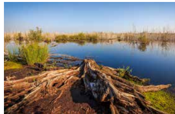
Von Moor zu Moor in vier Etappen