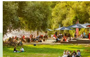
Urlaubsfeeling am Ihmeufer

Auf 10,5 Kilometern führt diese Tour vom Südufer des Maschsees durch Europas größten Stadtwald, die Eilenriede. Am Tiergarten mit seinen großen Rotwildbeständen vorbei geht es weiter bis zum Wahrzeichen von Anderten, der Schleuse.