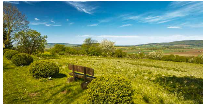
Aussicht ins Deistergrün