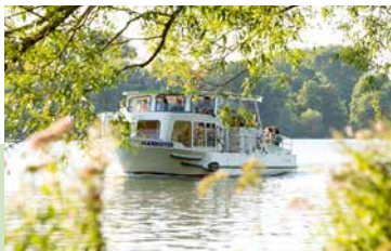
Maritime Stimmung entlang des Maschsees

Sehenswürdigkeiten im Fokus: auf der Hannover-City-Sightseeing Radtour