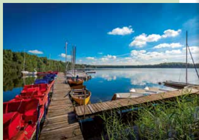
Urlaubsgefühle am Altwarmbüchener See