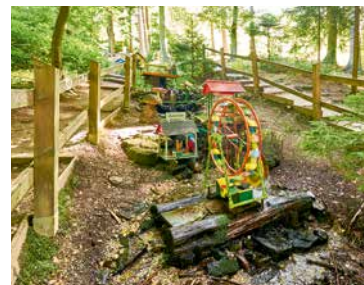
Ausflugziel: Die Wennigser Wasserräder

Der Deisterkreisel ist in vier Teilstrecken gegliedert. Er lädt dazu ein, Kultur, Natur und Sehenswürdigkeiten am Fuße des Deisters zu erleben.