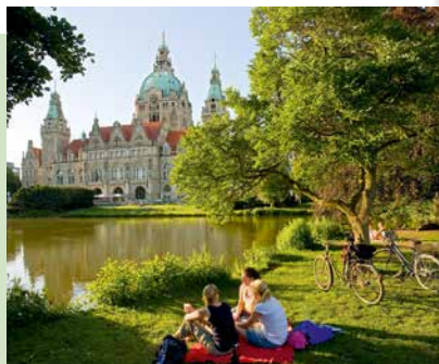
Fahrradpause mit Blick aufs Neue Rathaus

Die Teilnehmenden erwartet eine aktive Fahrrad-Erlebnistour rund um die grünen Oasen der Stadt und die Highlights zwischen Hauptbahnhof und der Altstadt. Ein Abstecher in das Neue Rathaus und zum Maschsee darf dabei natürlich nicht fehlen. Mit erfahrenen Guides geht es anschließend mit wertvollem Insiderwissen abseits der bekannten