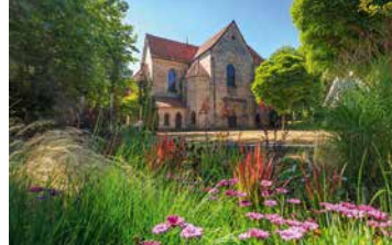
Auf dem Rad zum Kloster Barsinghausen