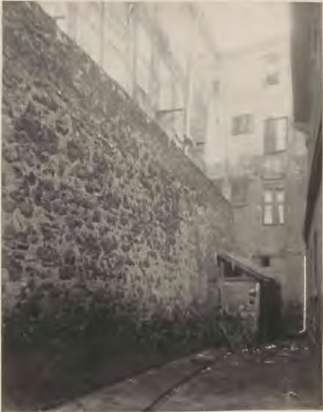
Mauer hinter der alten Synagoge.