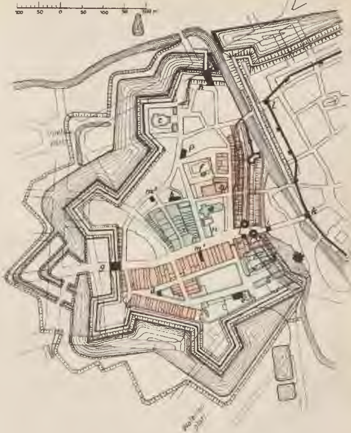
Planfisse der Calenberger Neustadt seit 1645.