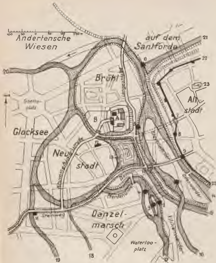
Planflizze der Göttinger Neustadt um 1380.