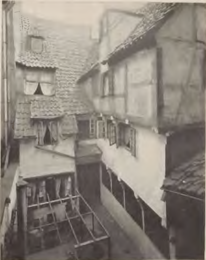
Hof eines Judenhauses auf dem Berge.