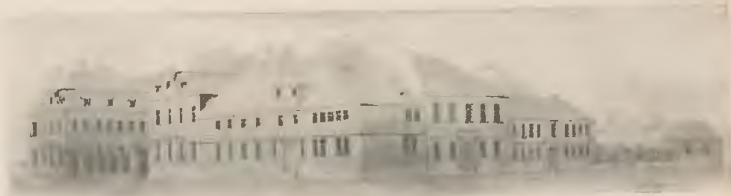
Das Georgianum und die 1862 abgerissenen Regierungsgebäude.