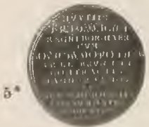
Neuerwerbungen des Refiner-Museums.