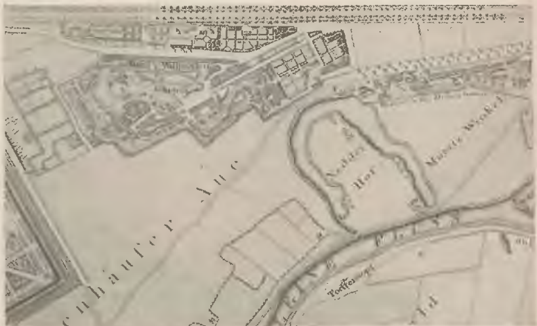
(Ausschnitt aus Benz-Bennefeldt 1800.)