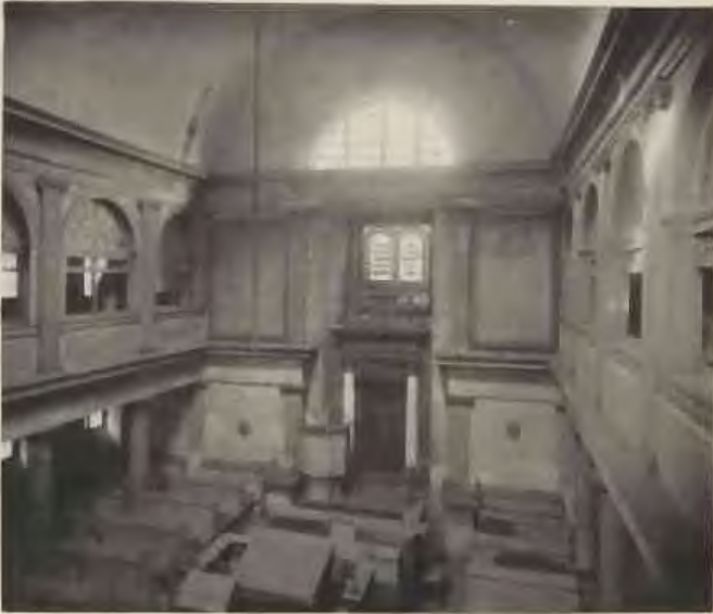
Inneres der alten Synagoge.