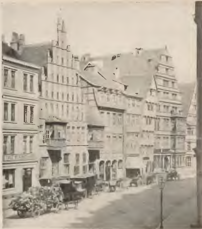
Schmiedestraße mit dem Stammhause der von Limburg-Setlingen.