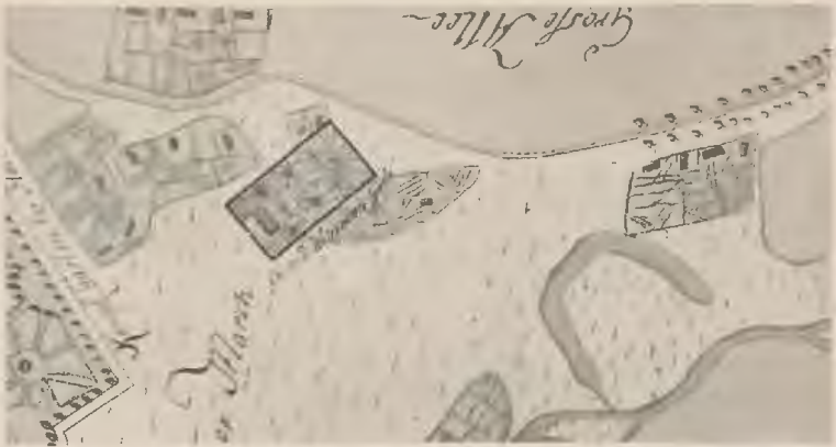
(Ausschnitt aus einer Karte von 1762.)