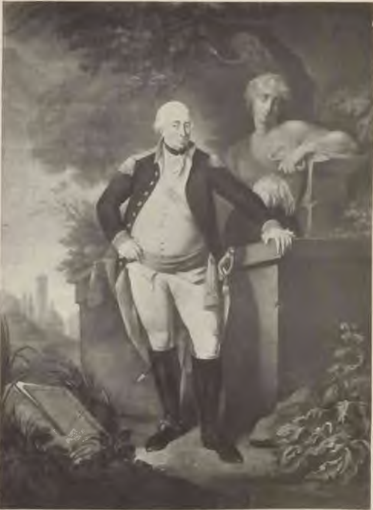
Graf Ludwig von Wallmoden-Gimborn (nach dem Schabkunstblatt von Huck).