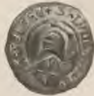
(S · LVDE)RI · DE · hATLACH(A) S · LVDARI · DE · hATALCH(A) Die ältesten Wappensiegel der von Setlingen (1382).