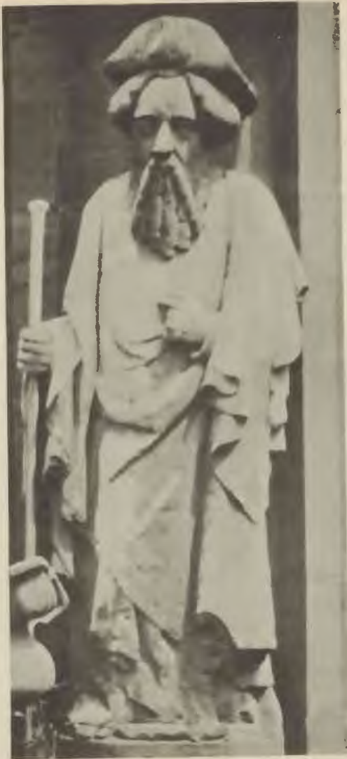
Abb. 2. Statue des hl. Jakobus d. Ä. am Westportal der Marktkirche.