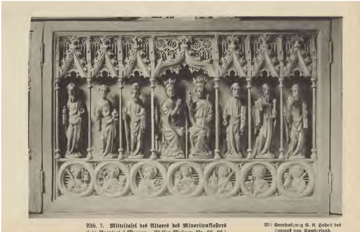
Abb. 7. Mitteltafel des Altars des Minoritenklosters (444. Original im Museum. Museum. No. 22. 22.)

Mit Genehmigung S. R. Hobelt des Bischofs von Cumberland.