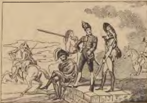
Ramberg: Spanisches Militär.

Eine so starke Truppe brachte natürlich auch eine Menge von Kranken und Blessierten mit. Da die Räume im Marstallgebäude nicht ausreichten, wurde die alte Tierarzneischule und die Kaserne der Leibgarde als Lazarett eingerichtet. Immerhin belebte sich der Geschäftsverkehr etwas, da den Soldaten der rückständige Sold und die Kriegszulagen ausbezahlt wurden und Neuanschaffungen an Uniformstücken notwendig waren.