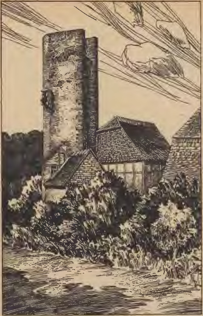
Turm in der Stadtmauer (jetzt Storchenturm genannt). (Nach einer Zeichnung des Herrn D. Becker.)