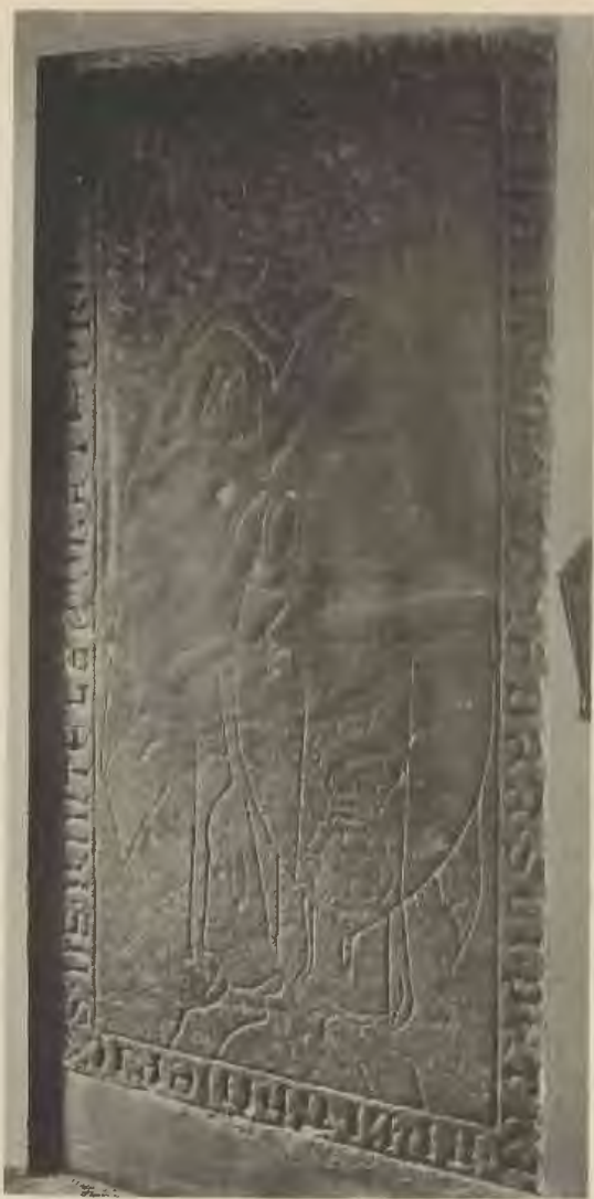
Abb. 3. Grabstein des Thidericus von Hinteln (Schloßkirche.)