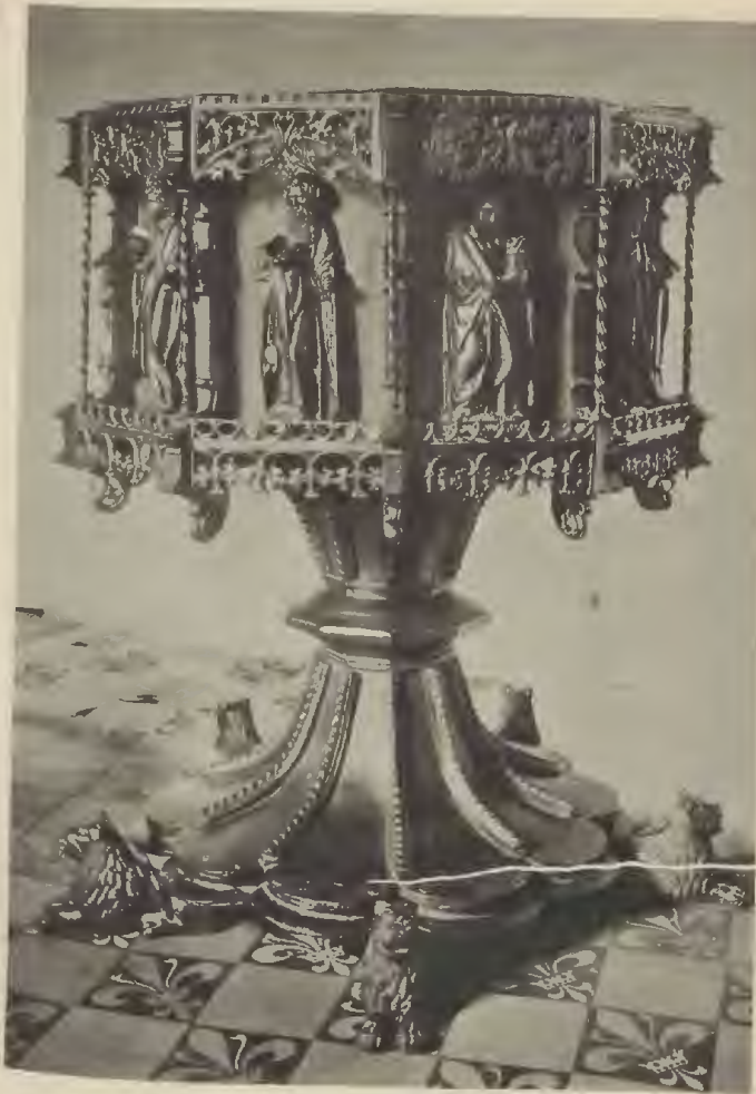
Abb. 6. Taufsteffel der Magdalenenkirche.