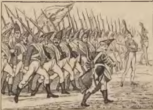
Hamberg. Russische Garde.

Obwohl die französische Besatzung in Hameln unbehelligt blieb, wagte ein Teil derselben einen Vorstoß gegen Springe, der aber kläglich endigte. Den alliierten Truppen fielen 2 Kanonen und einige Gefangene zu, die ein blutjunger Kosakenleutnant zum Ergötzen der Strassenjugend „mit vorgestreckter Lanze“ durch die Stadt führte. Die Ausrüstung der angeworbenen Legionäre, die fleißig einexerziert wurden, verschaffte Handwerkern und Geschäfts-