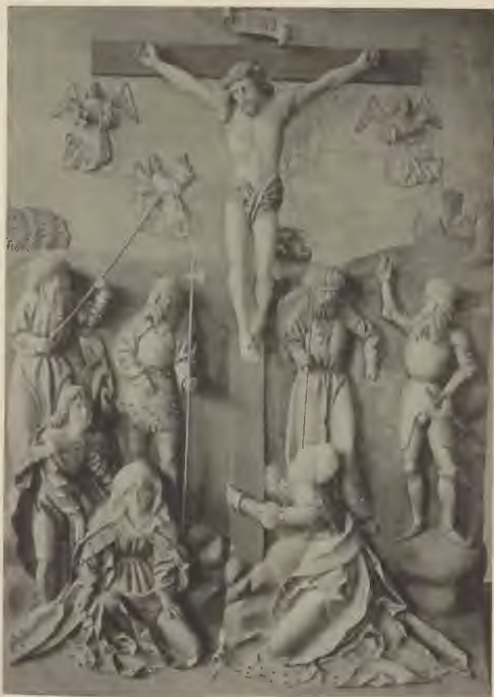
Abb. 10. Kreuzigung. Eichenholzrelief. Kestner-Museum (Zuv.-Nr. 541.)