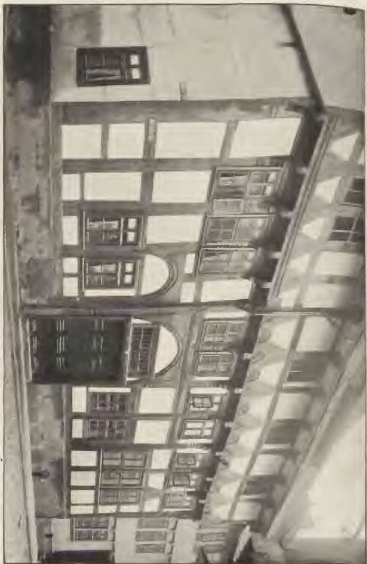
Patricierhaus (bes. Schnitt von dem Geschoß) an der Mühlenstraße (Seite des 16. Jahrhunderts).