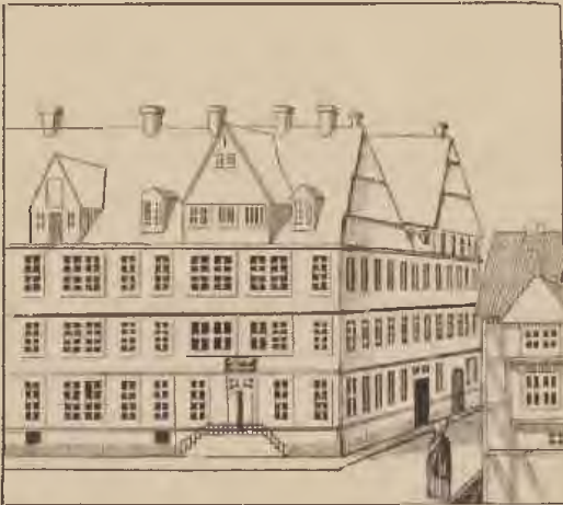
Die Londonschenke (1810). Original im Vaterländischen Museum.

Burgdorf marschiert war, wo er seinen Truppen einen Kasttag zgedacht hatte, aber den Ort durch eine am 25. Juni ausgebrochene Feuersbrunst völlig zerstört fand. Beim Einmarsche kannte der Jubel der Hannoveraner keine Grenzen. Jeder war eifrig bemüht, die Soldaten zu erquicken, deren manche vor Erschöpfung auf der Straße umfielen, ehe sie das schützende Quartier erreichten. Der Herzog selbst, in der historischen schwarzen Husarenuniform und der runden Kappe mit dem Totenkopf, stieg in der Londonschenke, dem jetzigen Armenhause, ab. Voll Eifer führte man die