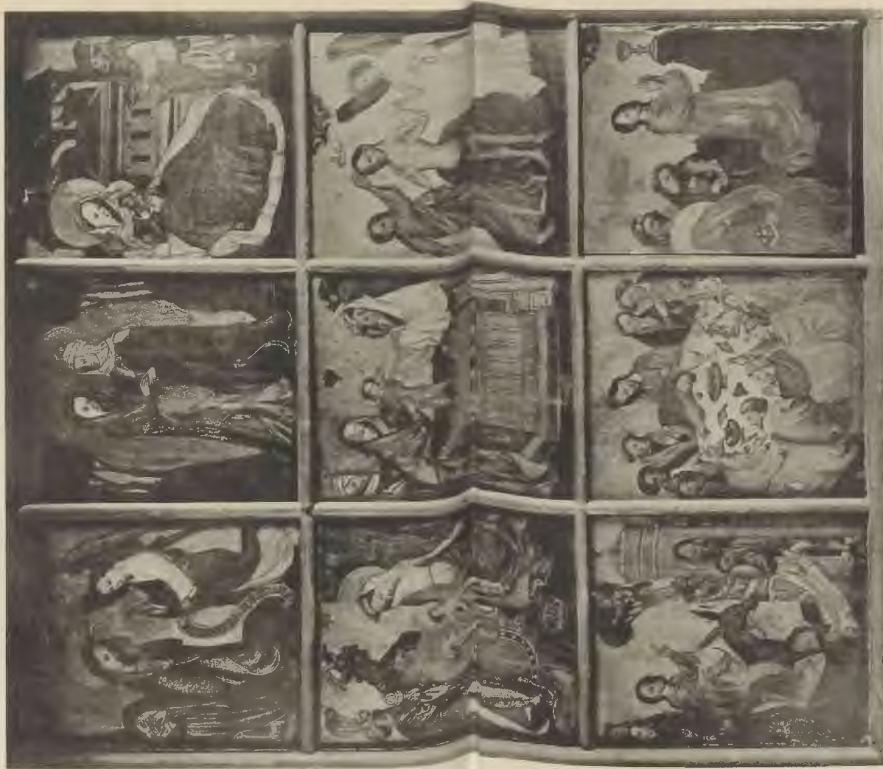
Abb. 12. Altar der Nicolaitapelle.