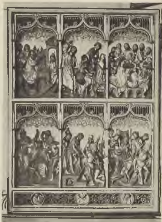
Abb. 9. linker Flügel des Altars der Megidienkirche (jetzt Prov.-Museum, Welken-Museum Nr. 23, 20.)

Mit Genehmigung S. R. Hoheit des Herzogs von Cumberland.