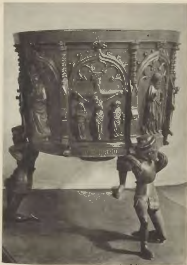
Abb. 5. Taufessel der Kreuzkirche.