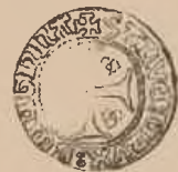
(Rückseite zu der mit dem Probezettel abgebildeten Vorderseite.)