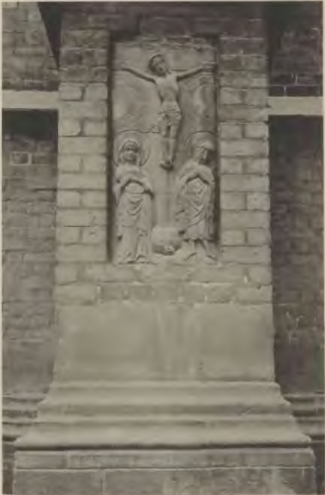
Abb. 4. Kreuzfigür mit Maria und Johannes am vierten Pfeiler (von D.) der Nordseite der Marienkirche.