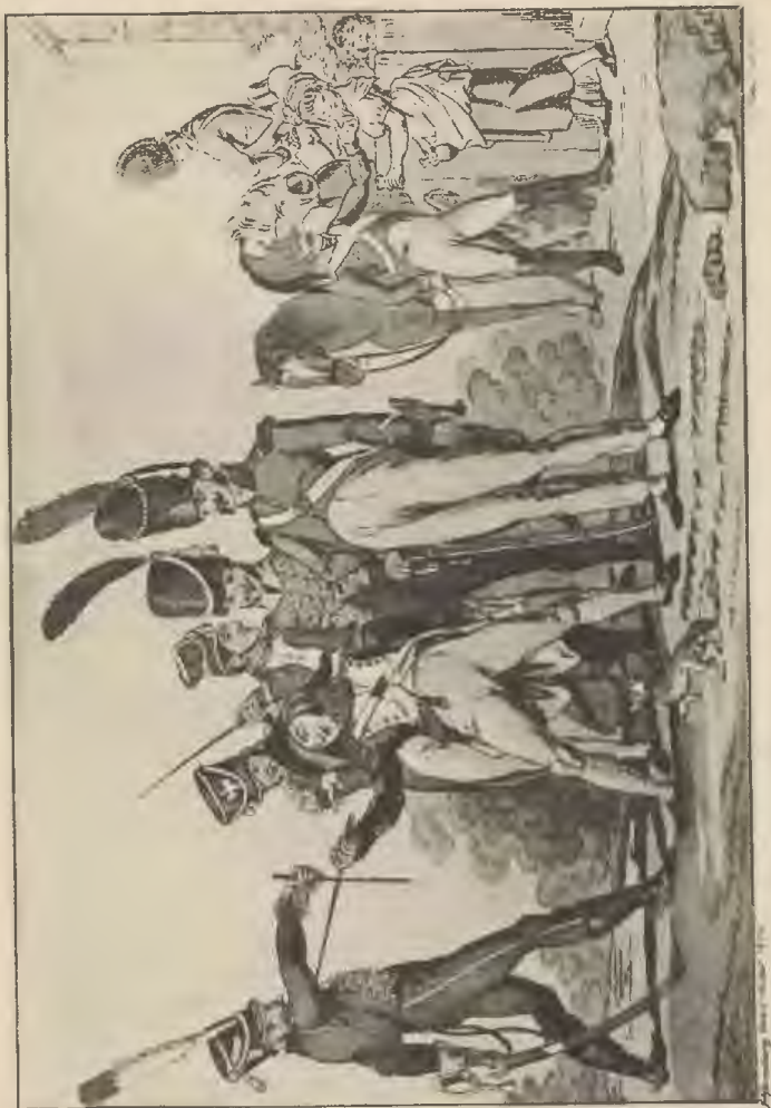
Hamburg: Französisches Militär. Nach einem kolorierten Stiche im Kestner-Museum.