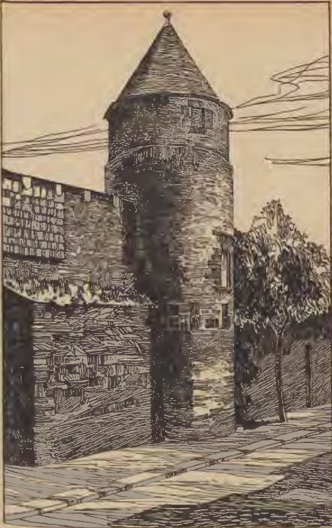
Turm in der Stadtmauer (Pulverturm). (Nach einer Zeichnung des Herrn D. Becker.)