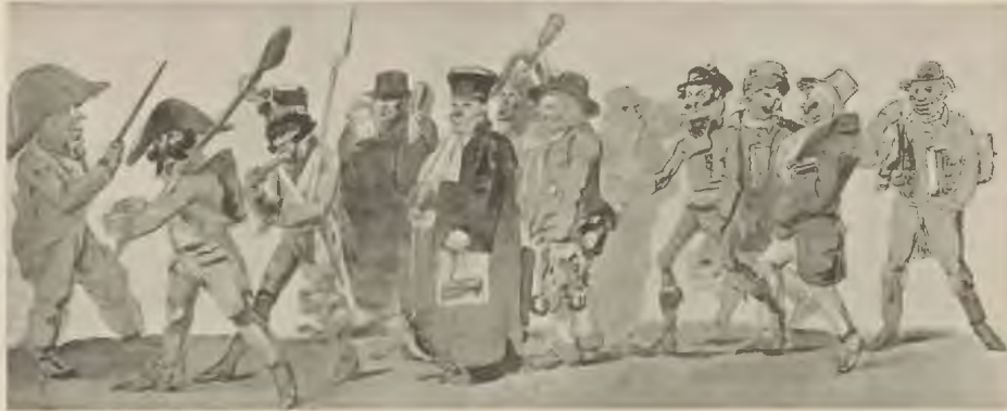
Skizze auf den Abzug der Franzosen 1813. Nach einem Aquarell im Vaterländischen Museum.