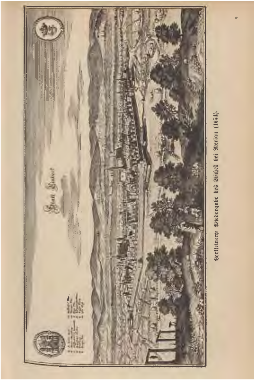
Verticinerne Siedergobe des Siedes bei Merian (1654).