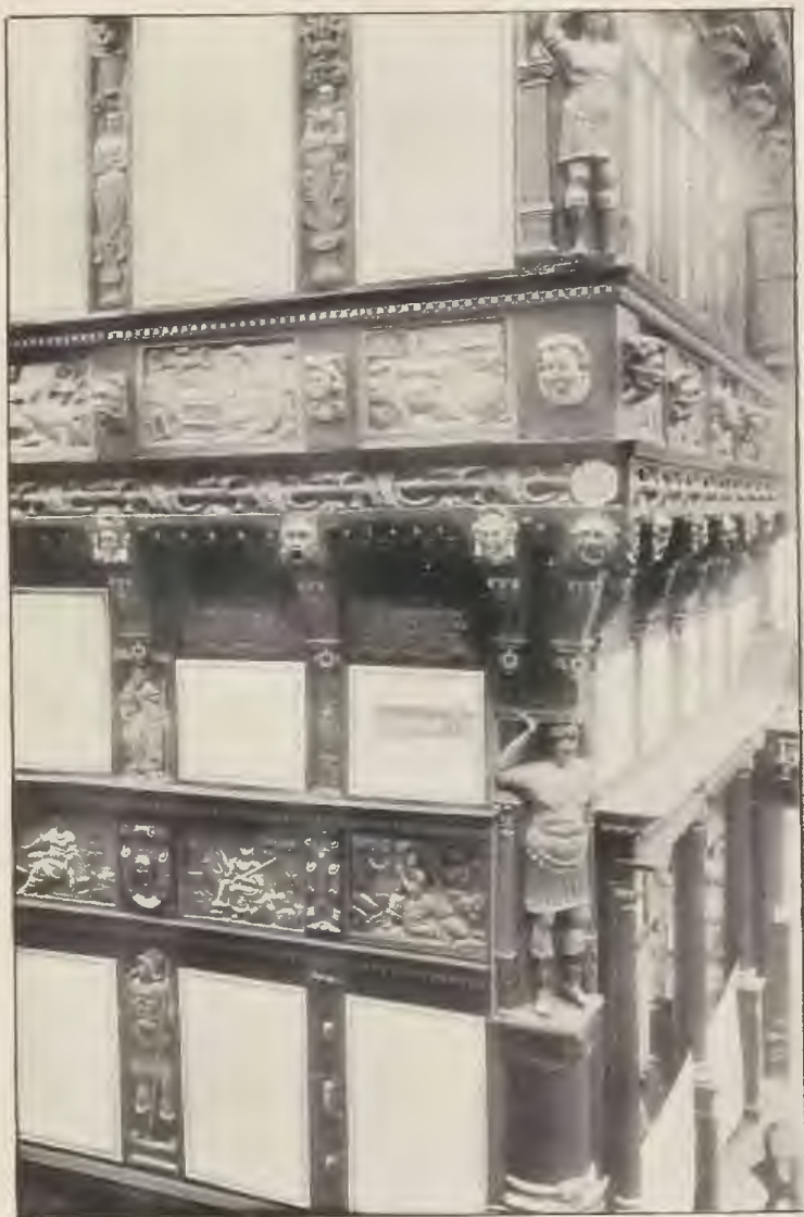
Einzelheiten vom Eideichen Hause.