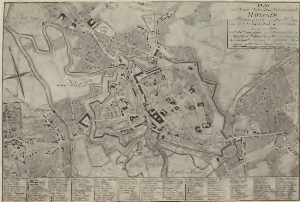
Plan der Stadt Hannover vom Jahre 1800. Original im Kalexändischen Museum.