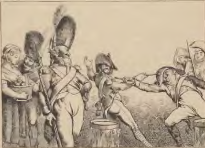
Straßenszene aus der Franzosenzeit.

Das Sanitätswesen wurde unter Aufsicht der Truppenärzte verständig gehandhabt, soweit ihnen nicht die heillose Beamtenwirtschaft der Commissaires ordonnateurs die Hände band. 1) Ein Militärlazarett von ca. 200 Betten war im Marstalle eingerichtet. Die Mehrzahl der Kranken litt