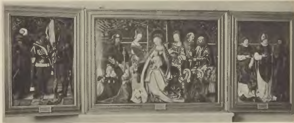
Abb. 14. Triptychon aus dem Schlosse Calenberg (jetzt Provinzial-Museum, Fidelkonntz-Galerie des Gesamthauses Braunschweig-Lüneburg Nr. 423.)

Mit Genehmigung S. K. Hohelt des Herzogs von Cumberland.