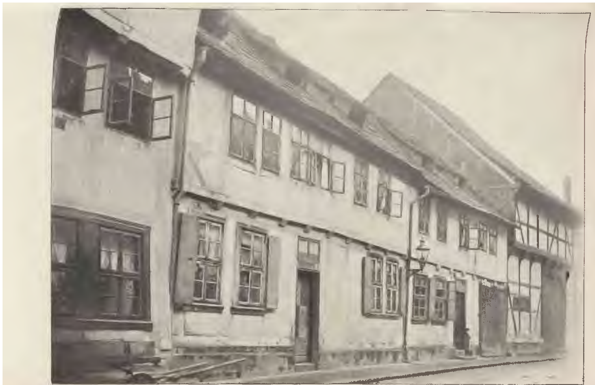
Zwei Häuser an der Holperstraße aus der Mitte des 18. Jahrhunderts (1735 und 1743).