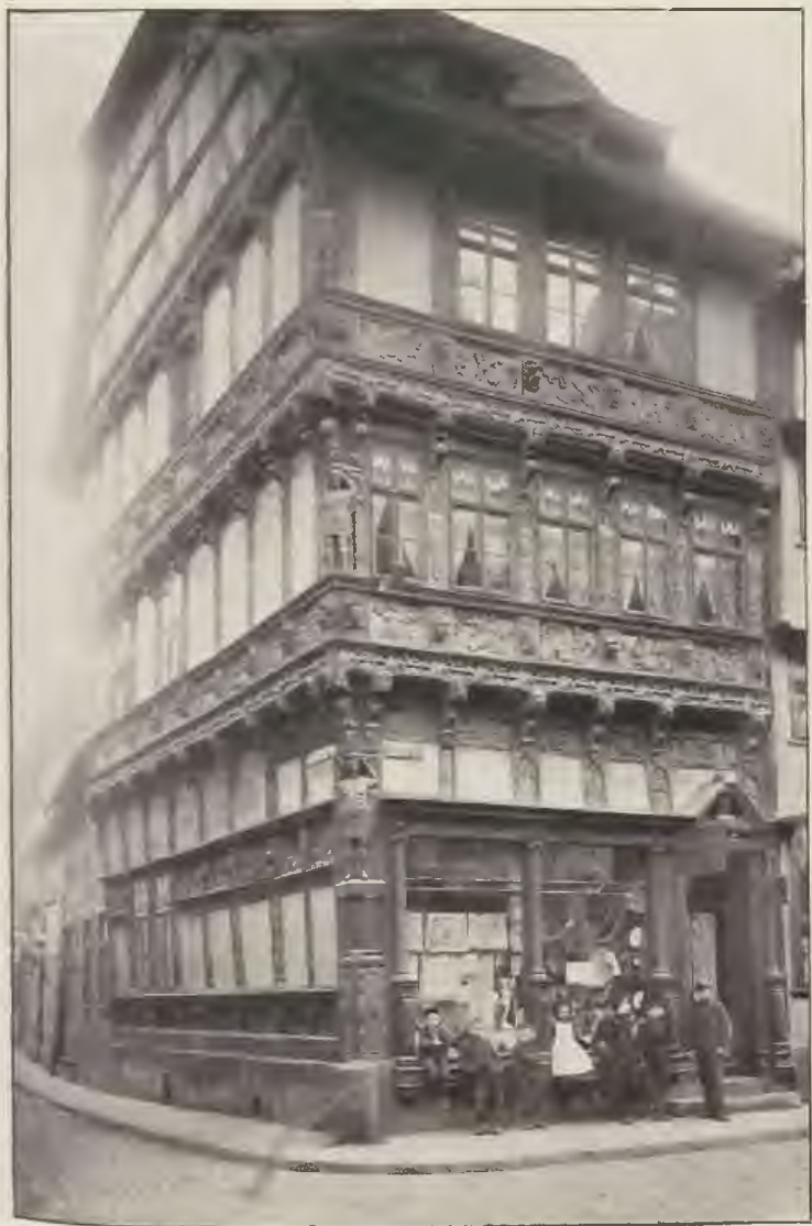
Das Eideckje Haus an der Marktstraße (wahrscheinlich aus dem Anfange des 17. Jahrhunderts).