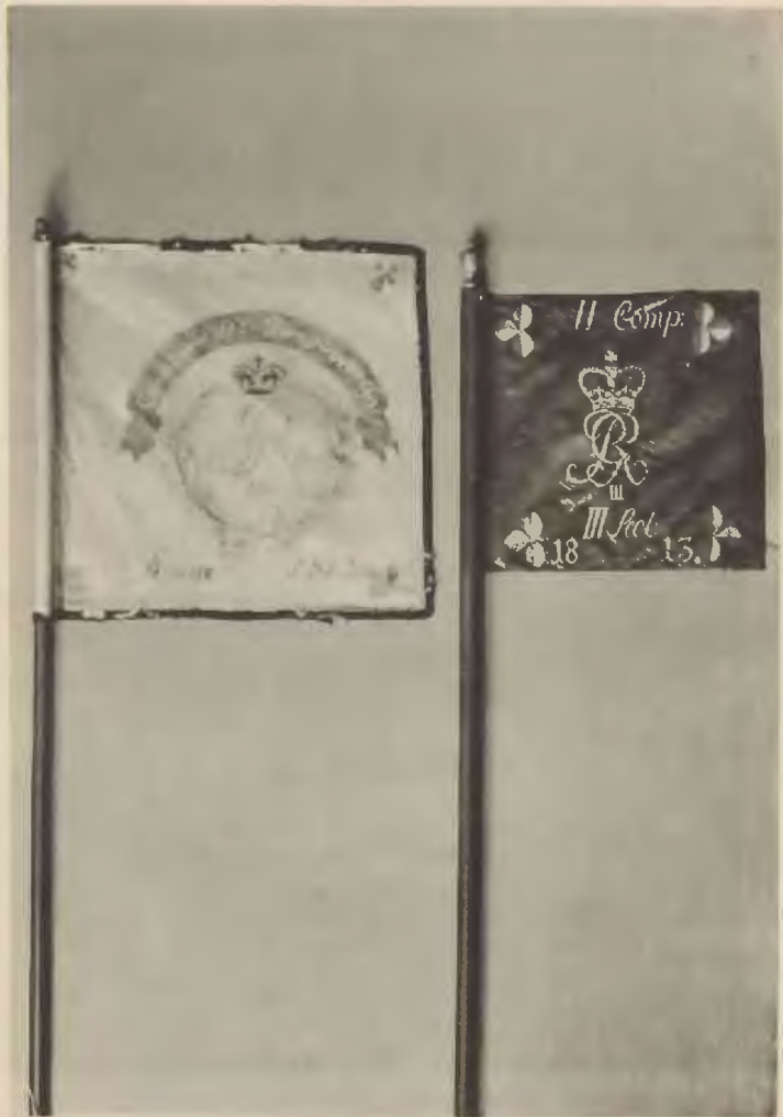
Fahnen der hannoverschen Bürgerwehr 1813 (links Kavallerie-, rechts Infanteriefahne). Originale im Vaterländischen Museum.