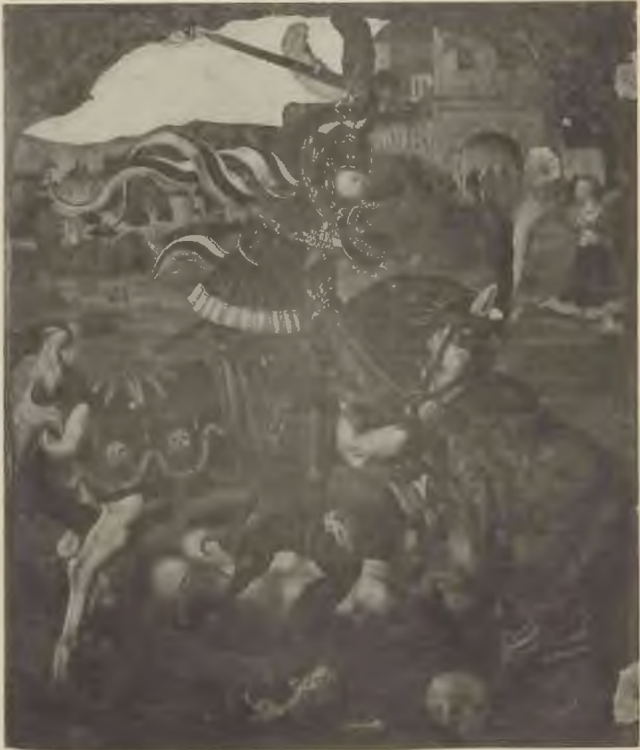
Abb. 15. Der hl. Georg im Kampfe mit dem Drachen. Delgemälde auf Eichenholz. (Sakristei der Marktkirche.)