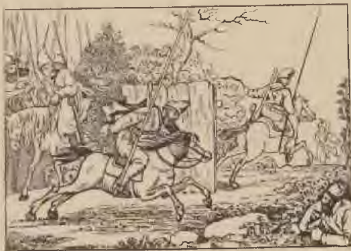
Ramberg : Kosaken.

Die allgemeine Freude währte jedoch nicht lange. Bald tauchten neue Befürchtungen auf, die nur zu sehr berechtigt waren. Napoleon suchte nämlich Preußen gegen England auszuspielen und bot ihm die Besetzung des Kurfürstentums Hannover an. Diefelbe war zwar nach der Proklamation Friedrich Wilhelms III. vom 27. Januar 1806 lediglich als „Verwahrung und Administration bis zum allgemeinen