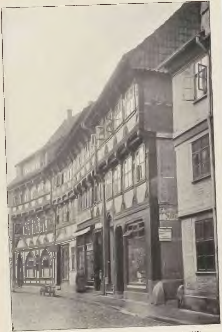
Häuser an der Langenbrücke aus dem 16. Jahrhundert (1557—1608).