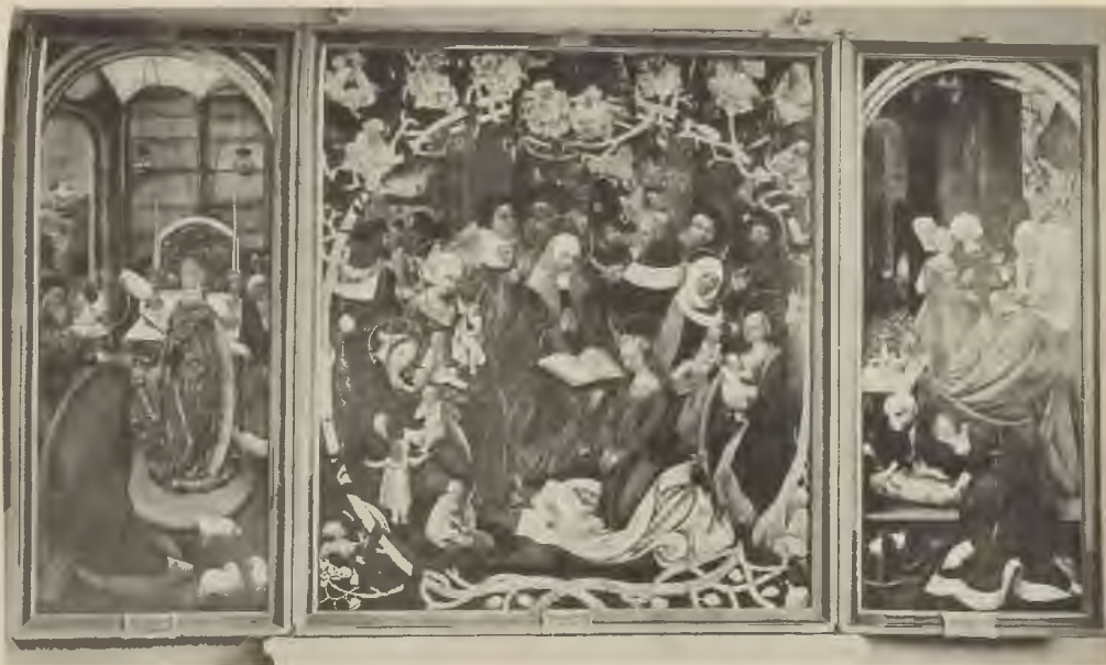
Abb. 13. Triptychon aus der Kreuzkirche (Provinzial-Museum, Fidelkommiß-Galerie des Gesandthauses Braunschweig-Lüneburg Nr. 425.)

Mit Genehmigung S. R. Hohelt des Herzogs von Cumberland.