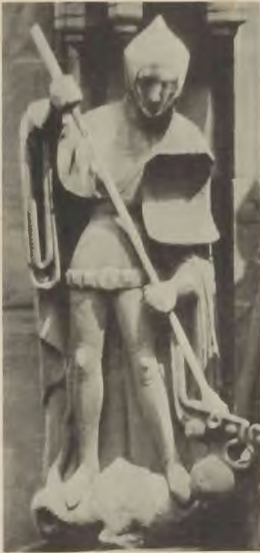
Abb. 1. Statue des hl. Georg am Westportal der Marktkirche.