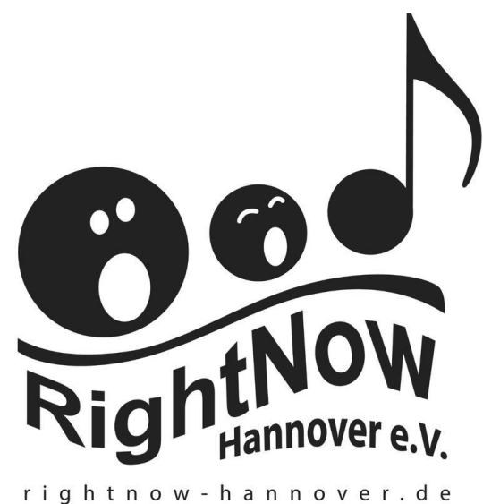
Donnerstags