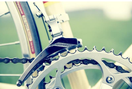
Fahrrad reparieren

jeden 2. und 4. Donnerstag von 15:00 - 17:00 Uhr