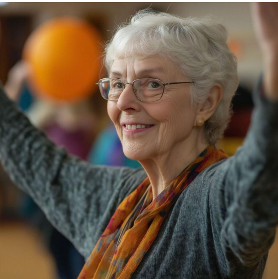
Fit im Alter

Demnächst: Donnerstags, ab dem 14.11.2024, 11:45-12:30 Uhr