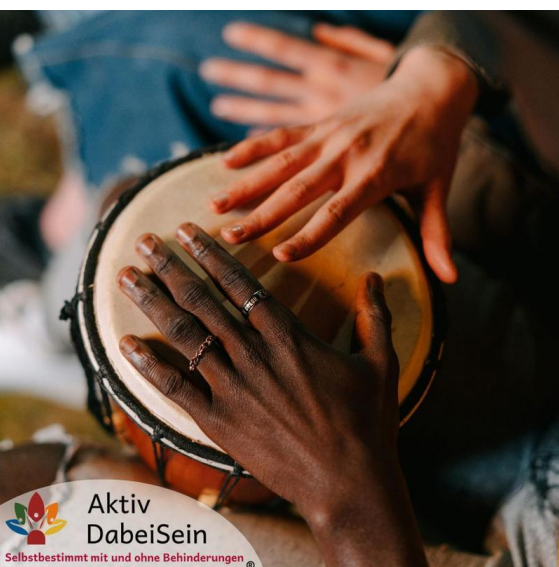
Freitags