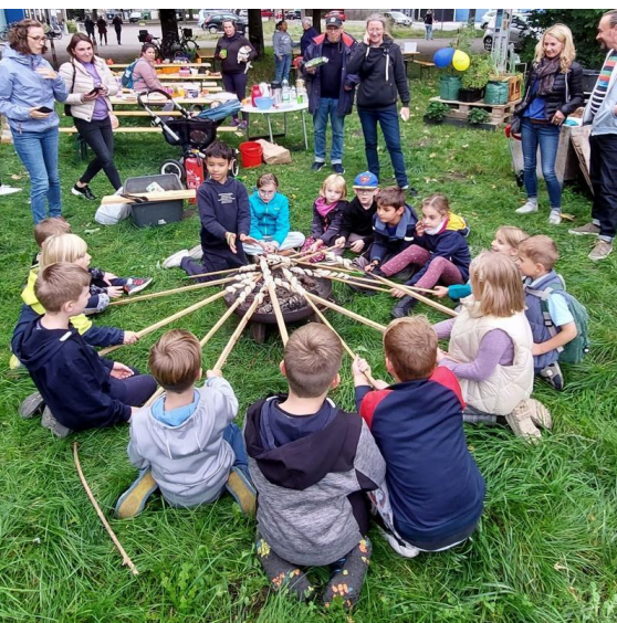
Erntedank PaGaMiA

Veranstalter*in: Stadtbibliothek Misburg