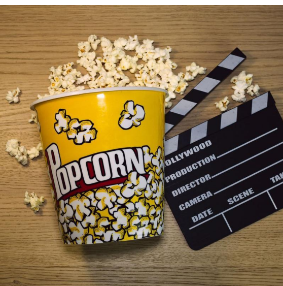
Kintopp KSH

Veranstalter*in: Eine Kooperation zwischen Kulturbüro Misburg-Anderten und SoVD Misburg