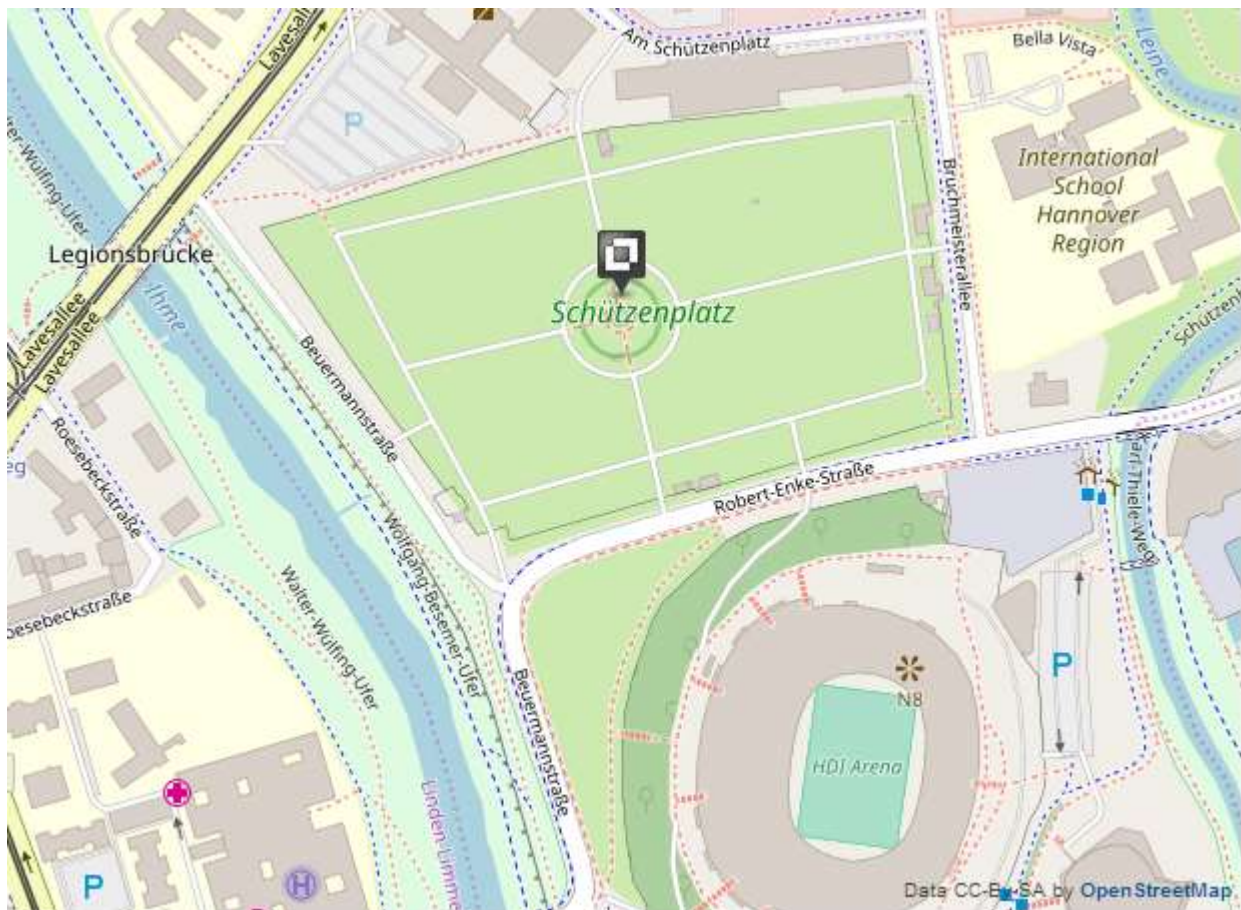
Abbildung 1 - Umfeld Schützenplatz

Über das Jahr verteilt finden daneben zahlreiche weitere Großveranstaltungen auf dem Platz statt, es gibt seit einigen Jahren einen Weihnachtszirkus und es gastieren regelmäßig zweimal jährlich Großzirkuse auf dem Schützenplatz. Zudem dient der Schützenplatz als Hauptparkplatz für die Besucher der benachbarten Heinz-von-Heiden-Arena, in der die Heimspiele des Fußballvereins Hannover 96 und andere Veranstaltungen stattfinden.